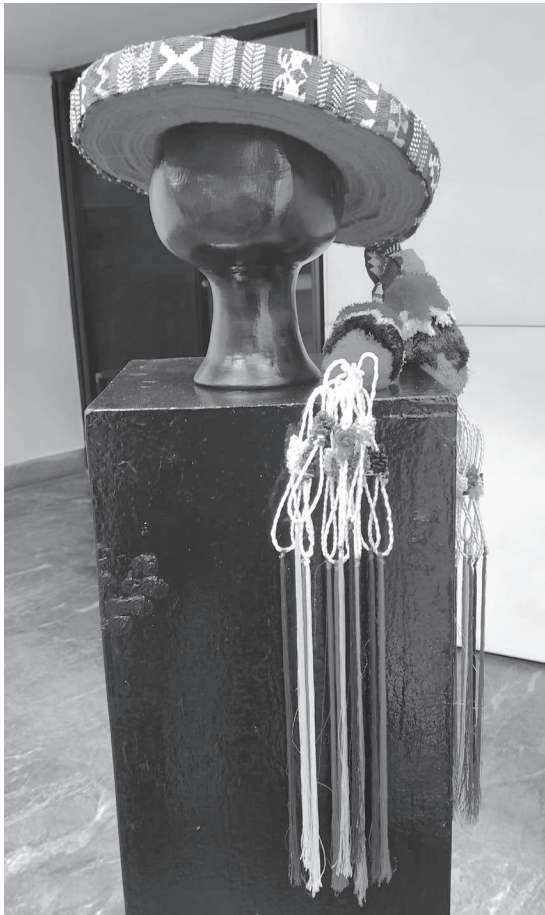
Figura 11. Ixcap pieza perteneciente a la colección del Museo Ixchel del Traje Indígena