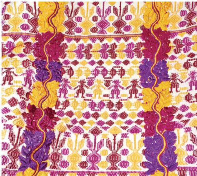
Figura 3. Diseño de ranta tradicional indumentaria propiedad de Doña Elsa Quijivix de Vásquez.