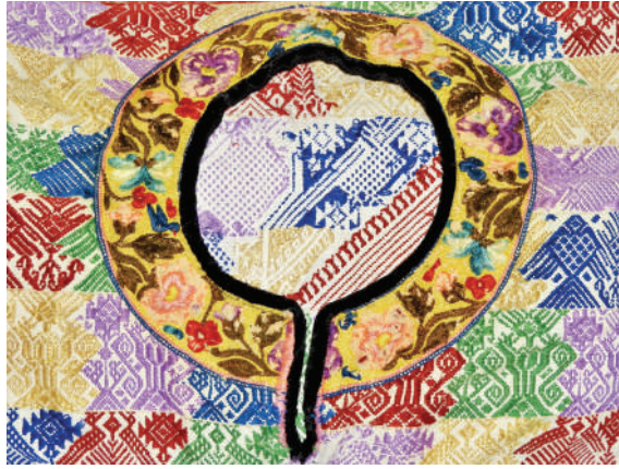
Figura 5. Huipil perteneciente a doña Elsa Quijivix de Vásquez.