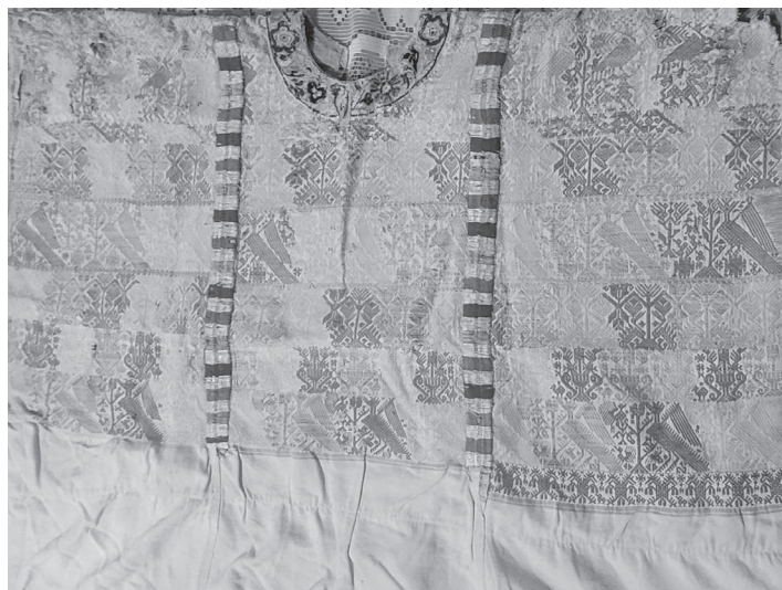
Figura 17. Pieza de la familia Castro con una antigüedad de más de 100 años que muestra que a pesar del tiempo los colores no cambian.