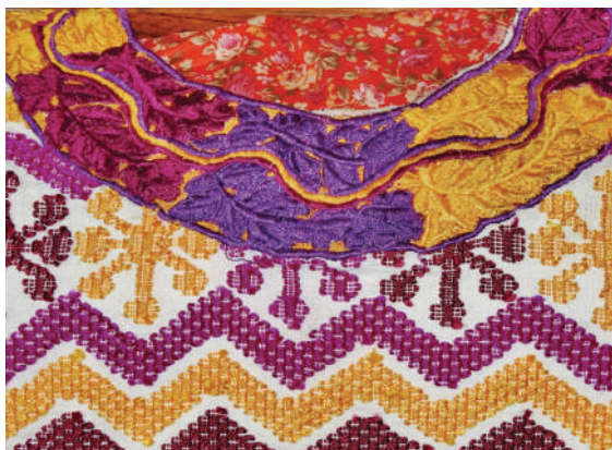
Figura 9. Movimiento de la serpiente representado en el textil tradicional