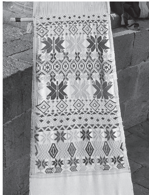
Figura 16. Pieza textil de Gabriela Racancoj Escobar.