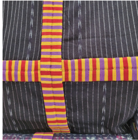
Figura 7. Ranta bordada