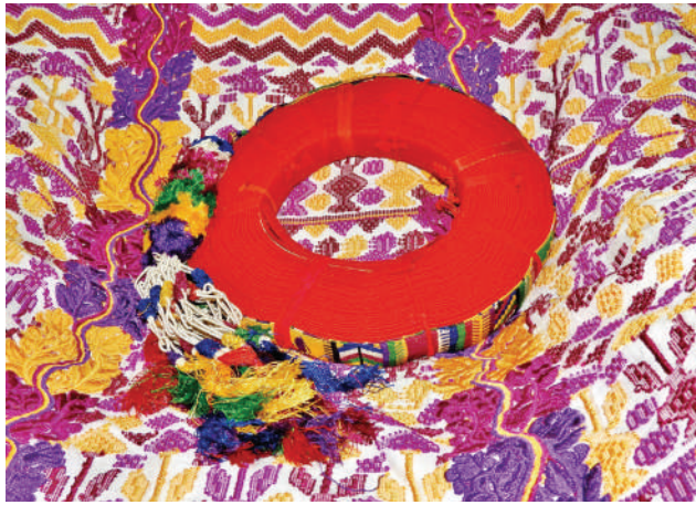
Figura 1. Ixcap propiedad de Doña Elsa Quijivix de Vásquez.