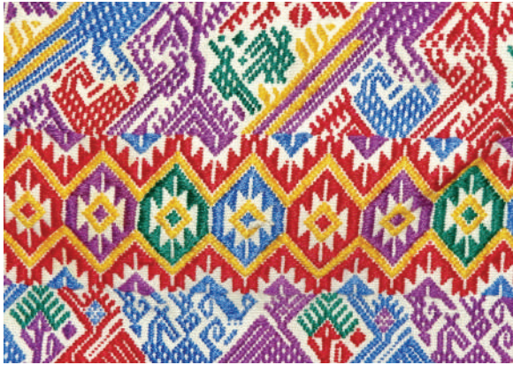
Figura 6. Detalles de estrellas y símbolos puntiagudos, huipil perteneciente a doña Elsa Quijivix de Vásquez