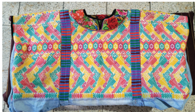
Figura 4. Fotografía tomada por el autor, huipil perteneciente a la señora