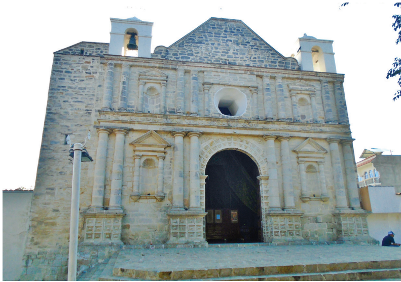
Figura 1. Iglesia parroquial dedicada a San Andrés Apóstol, patrón de San Andrés Sajcabajá, Quiché (2024).