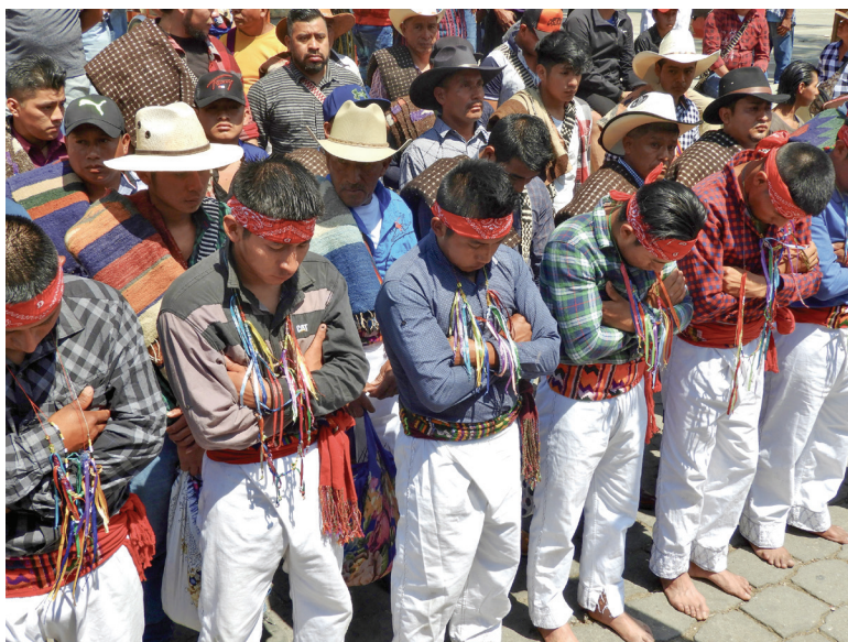
Figura 3. Un grupo de gateadores reza frente a la iglesia parroquial antes de iniciar su penitencia (2022).