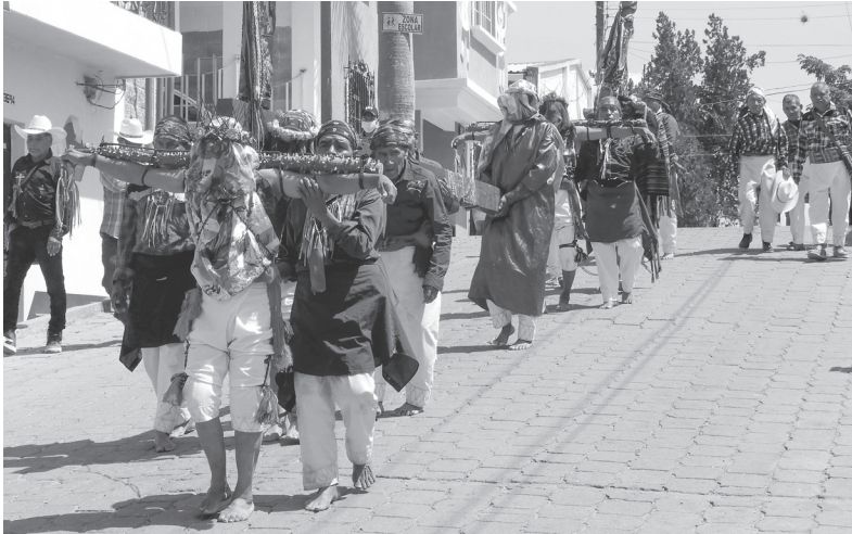
Figura 16. Los ximones y changaliques en su recorrido penitencial la mañana del Viernes Santo (2022).