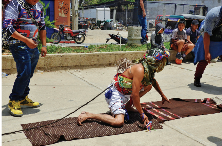
Figura 8. Un gateador cumpliendo su promesa la mañana del Viernes Santo (2024).