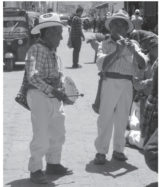
Figura 17. Los calacas van tocando el tambor y la chirimía (2024).