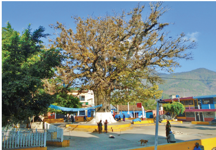
Figura 2. Ceiba en el parque central de San Andrés Sajcabajá, Quiché (2024).