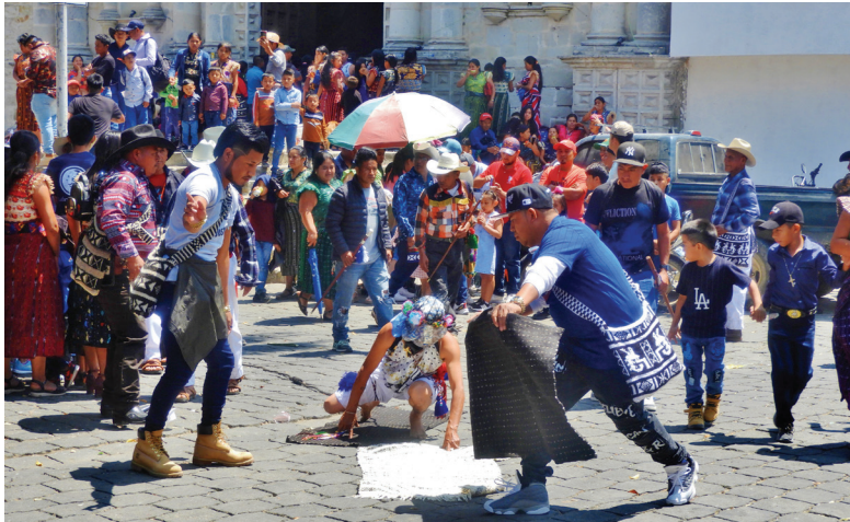
Figura 9. Los gateadores se hacen acompañar por dos ayudantes que los van guiando durante su recorrido penitencial (2024).