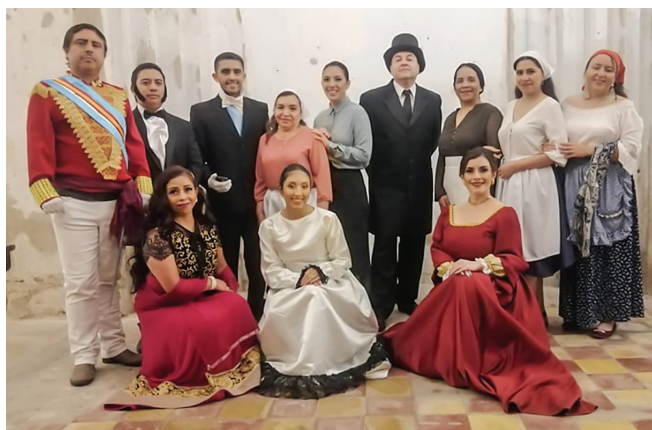
Figura 9. El elenco de Necroturismo en Guatemala tras una presentación efectuada en el convento de la basílica de Santo Domingo de Guzmán.