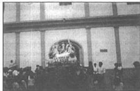
Procesión de Santa Rosa de Lima, patrona de la aldea Santa Rosita, Zona 16.