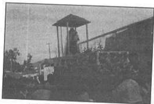
Procesión de la Virgen del Carmen, colonial el Carmen zona 6

En 1880 es mencionada como caserío del departamento de Guatemala. "Caserío del departamento de Guatemala, depende de la jurisdicción de las Vacas". El Fundo mide cinco caballerías en las cuales se cultiva café, caña de azúcar, zacatón para pastos de ganado, 62 habitantes". Como caserío la Chácara aparece en la Demarcación Política de la República de Guatemala", 1892. (Diccionario Geográfico).