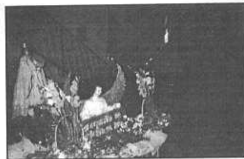
Anda de Nuestra Señora de la Asunción, patrona de la Aldea Canalitos, zona 17, que sale la madrugada del día 15 de Agosto en procesión de la Aurora, 15 de agosto de 2001.

Canalitos aparece en la demarcación política, de 1892 como municipio del departamento de Guatemala, y su nombre original es "Canalitos de la Asunción"; es suprimido del 17 de Agosto de 1938, anexándolo como aldea del municipio de Guatemala. Sin embargo se tienen elementos, que como asentamiento ya existía antes del traslado de la capital hacia el valle de la Ermita, por lo que sus celebraciones son bastante antiguas.