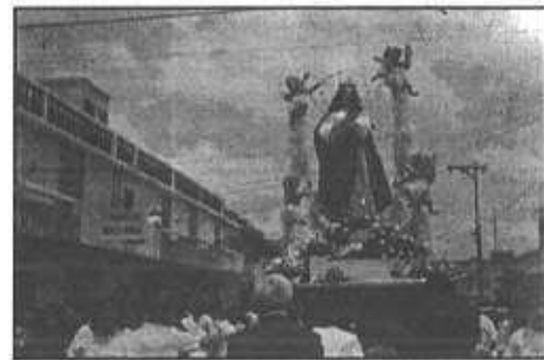
Procesión de la Virgen de la Asunción: parroquia Santo Cura de Ars, (Padre Chemita), zona 5; 15 de Agosto del 2001.

A su paso encuentra frentes de casas adornados, alfombras, gran cantidad de cohetería. Su recorrido tarda unas 3 horas, acompañado de una banda de música.