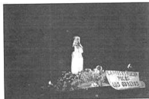
Procesión de Santa Rosa de Lima; colonias Chácara y Saravia, zona 5. 29 de Agosto 2001.

Santa Rosa de Lima, es la patrona de las colonias Chácara y Saravia en la zona 5; según informantes (estudiantes de la U.R.L., Antigua Guatemala) en la salida de Antigua Guatemala hacia la capital aún existe una hacienda llamada la Chácara, la cual durante la colonia estuvo bajo el control de los dominicos y tenía como patrona a Santa Rosa de Lima; con el traslado de la capital en 1776, la hacienda es trasladada asentándose en el Valle de las Vacas. (Hermano Norman, parroquia San Juan Bautista).