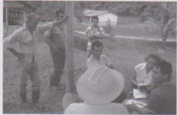
Xjalam uuch junqaq reheb' li komonil yookeb' rilb'al ut rab'inkil li molok esil yookeb' chi ru li tijleb'aal. Vecinos observan y escuchan la entrevista, frente a la iglesia.