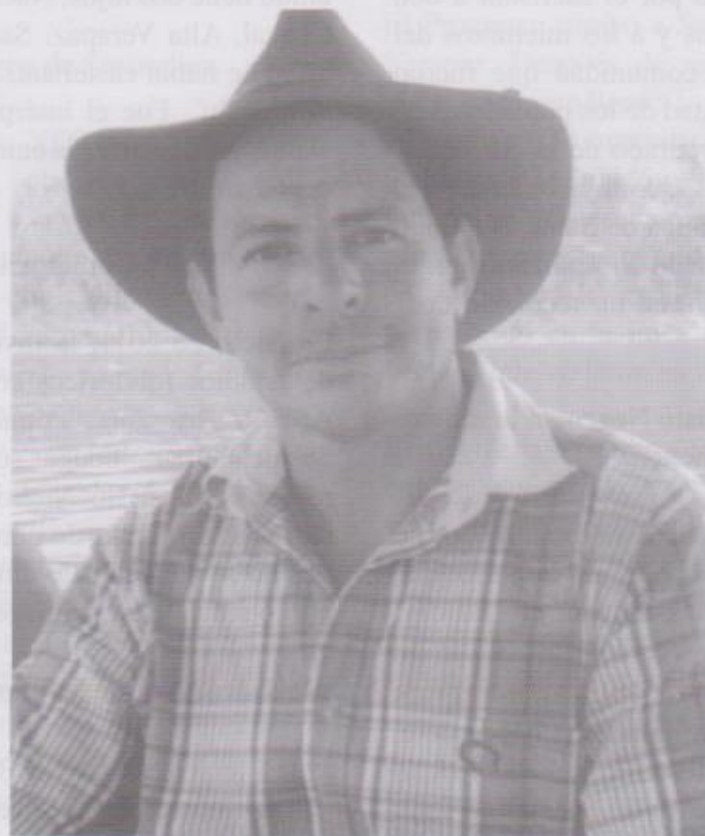
A'in xjalam u li Ingeniero kishok re li Cristo El Ingeniero, donante de la imagen