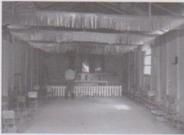
Xjalam uuch chan ru na'iloc xsa' li tijleb'aal Interior de la iglesia.