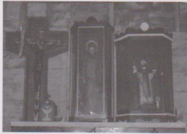
A'ineb' li jalam uuch wankeb' sa' li tijleb'aal. Qawa' Kux ut Qawa' Ku' (San Marcos y Santo Domingo) Imágenes de la iglesia: Cristo Negro, San Marcos y Santo Domingo.