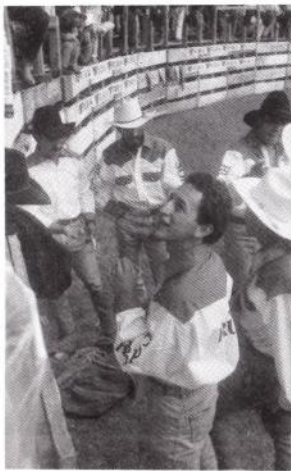
Equipo de Cabañas Zacapa preparandose para salir.

Al finalizar la oración, como algo extraño, se aplaude pero de una manera diferente a un aplauso de emoción o alegría, se hace con mucho respeto según puede observar.