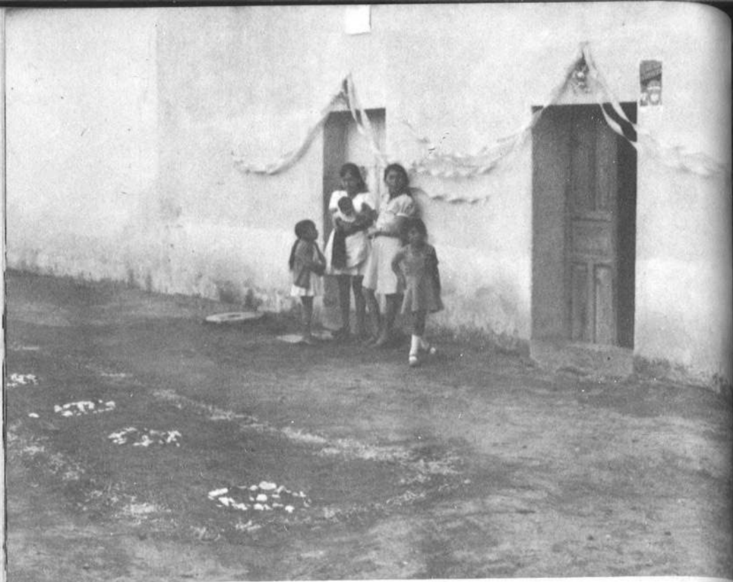
Alfombra de pino y pétalos de rosa y adornos de papel de china hechos para semana santa. Antigua Guatemala..