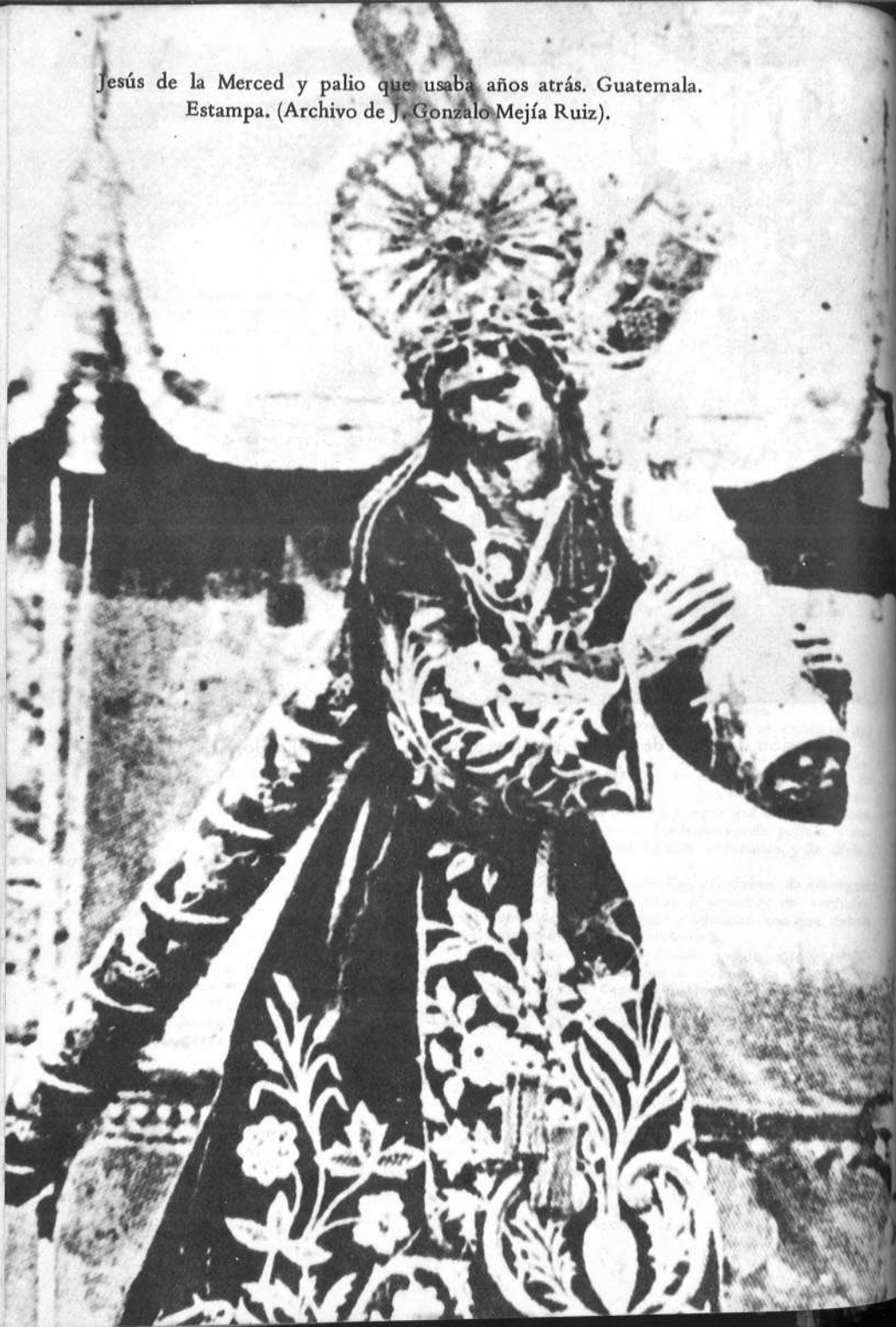
Jesús de la Merced y palio que usaba años atrás. Guatemala. Estampa.