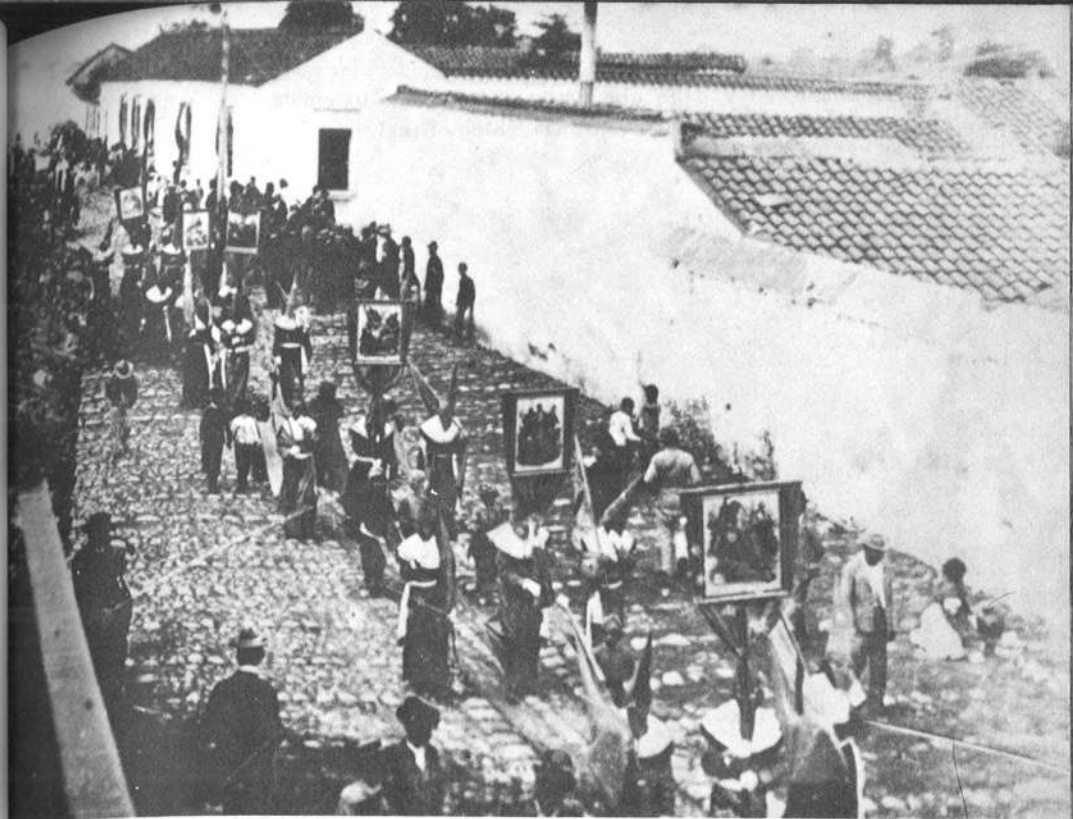
Procesión de Jesús de Candelaria (jueves santo), a fines del siglo XIX. Guatemala.