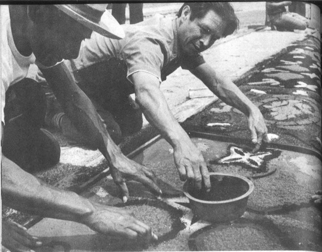
Confección de una alfombra de Semana Santa.