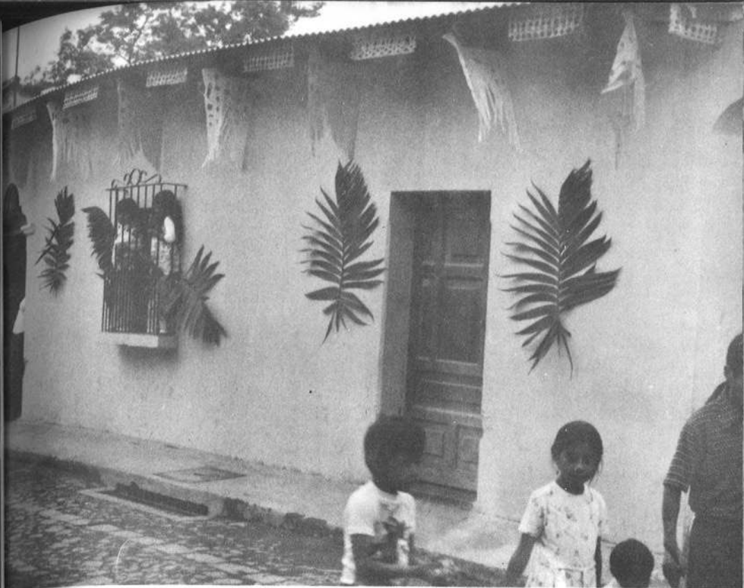
Adornos hechos para semana santa con hoja de pacaya y papel recortado. Antigua Guatemala.