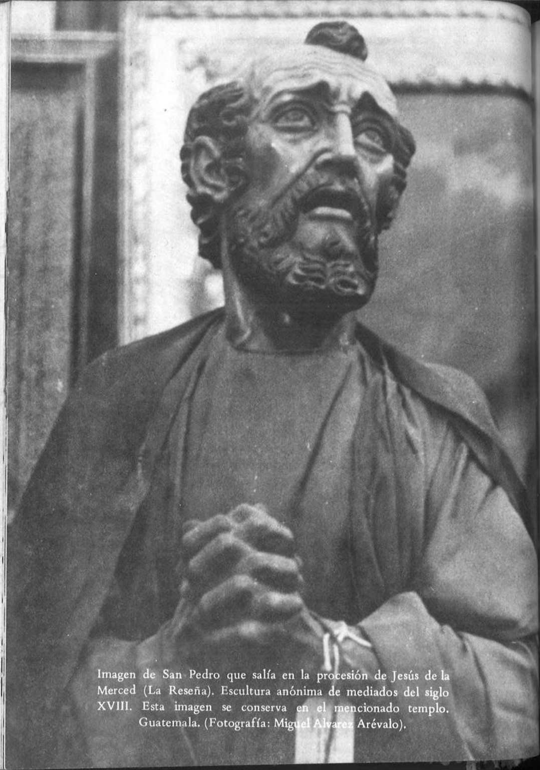
Imagen de San Pedro que salía en la procesión de Jesús de la Merced (La Reseña). Escultura anónima de mediados del siglo XVIII. Esta imagen se conserva en el mencionado templo. Guatemala. (Fotografía: Miguel Álvarez Arévalo).