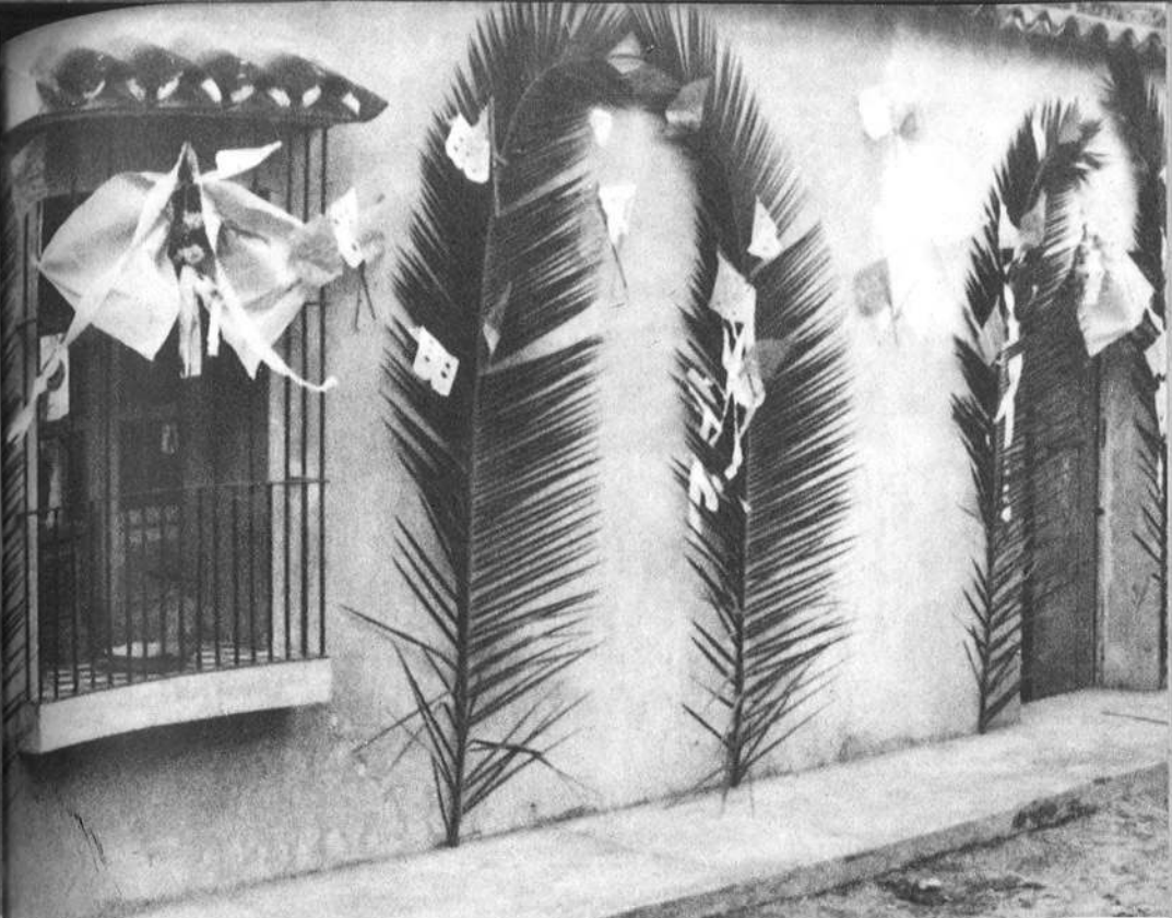
Adornos de papel recortado y hojas de pacaya hechos para semana santa. Antigua Guatemala.