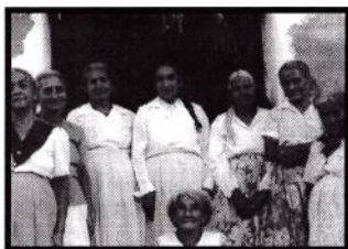
Devotas de "El Sagrado Corazón de Jesús" frente a "El Arca de la Alianza", aldea El Trapiche, El Adelanto.

evidencias bendijo a la pequeña y la declaró virgen tres veces. Veamos los siguientes versos: