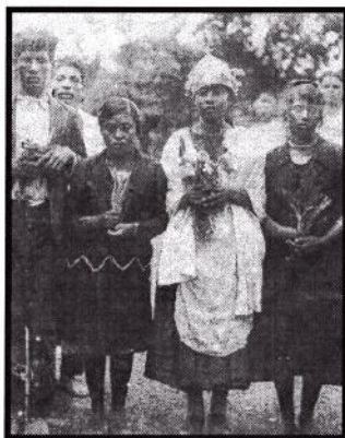
Resurrección y Coronación de El Santo Ángel en 1930.

"...el capitán hecho águila de los indios llegó a querer matar al