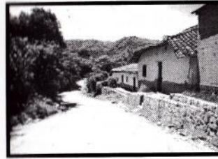
Una de las calles más importantes de la aldea El Trapiche.