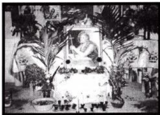
Altar de las devotas de El Santo Ángel.

Ángel de mi guarda amante y protector concédenos la calma en celestial amor. 15