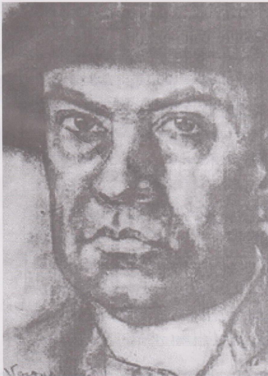
5. Rubén Darío, que estuvo en Guatemala en 1890.