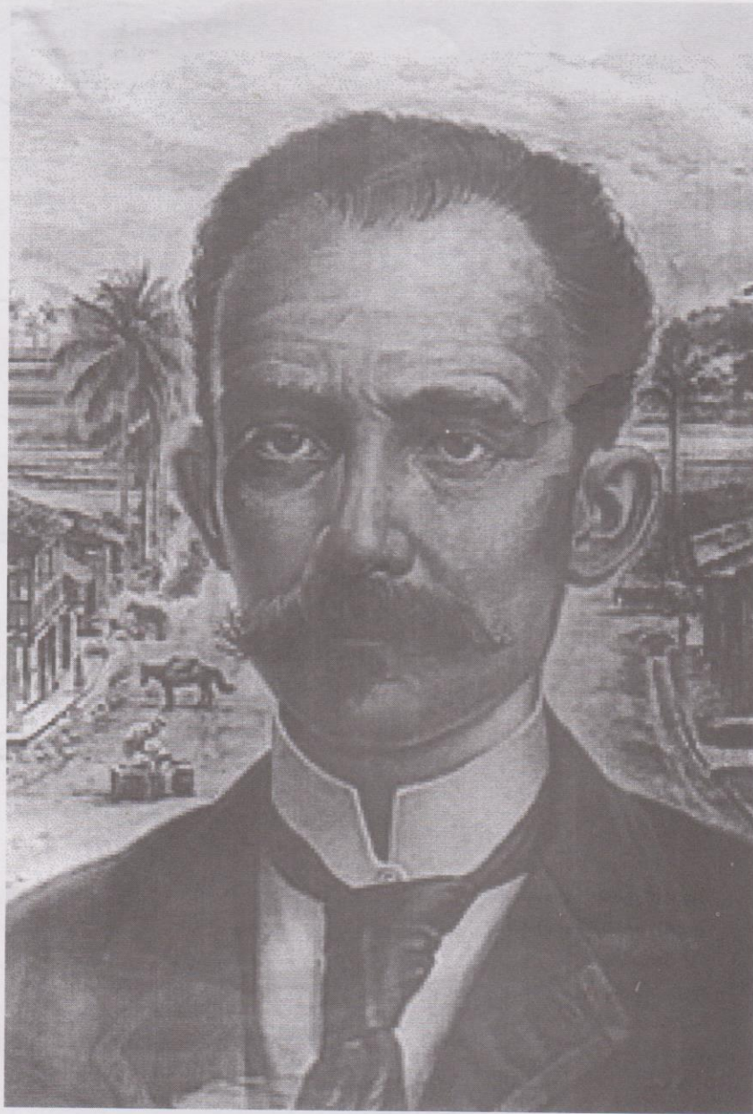
4. José Martí que estuvo en 1977 en Guatemala.