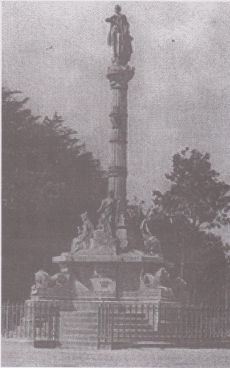
2. Monumento al General Miguel García Granados. (Av. de la Reforma).