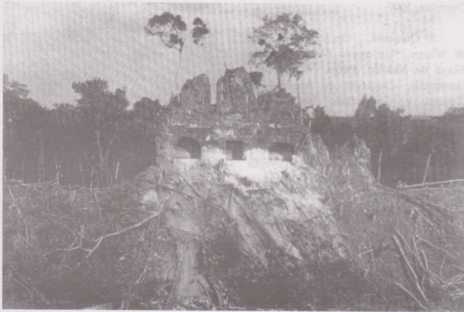
Figura3: Fotografía desde la plataforma superior del edificio "C", donde se puede apreciar la sección sur mutilada y con un árbol encima de los escombros.

que sugieren la cantidad poblacional de la zona, así mismo hacemos un llamado para las personas lectores e interesados en los temas culturales de importancia de nuestra cultura que contiene rasgos tan interesantes e importantes como lo son los arqueostereogramas, que son representativos de el gran adelanto de estas culturas y su profunda visión y convivencia con el mundo que los rodeo.