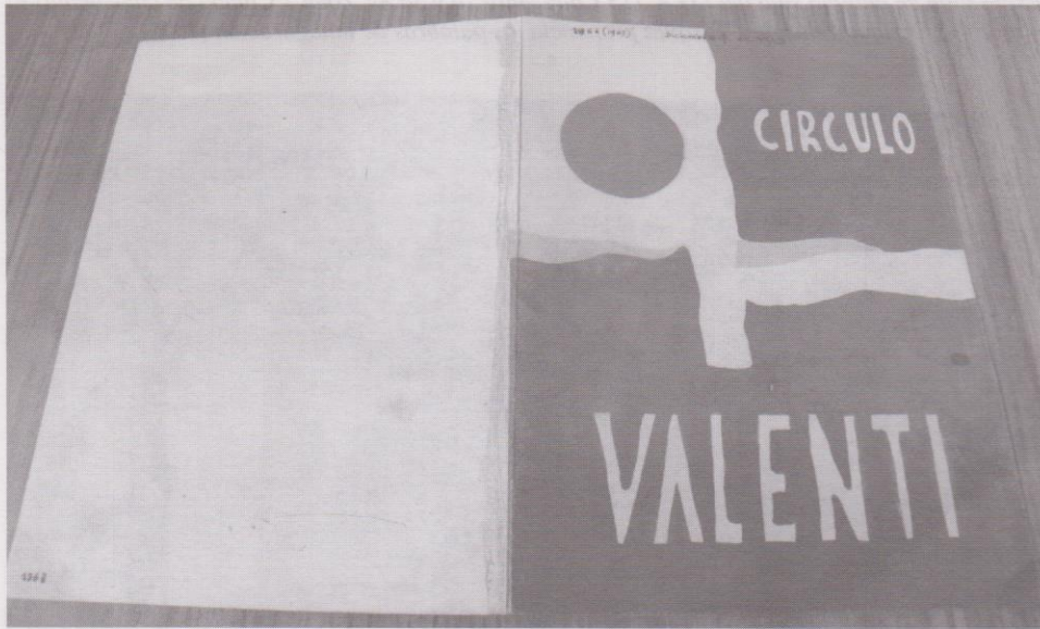
Catálogo de la exposición Inaugural del "Círculo Valenti" (1963)