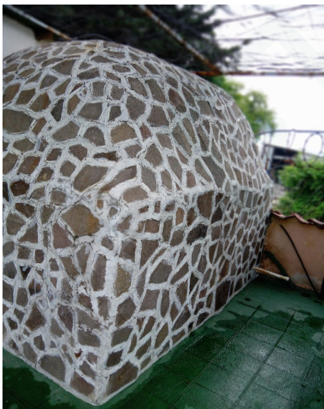
Figura 6. Temazcal, Amatitlán, Byron García, 2022

Normalmente yo vengo cada fin de semana, es algo que mi papá me enseñó desde pequeño, nos metíamos al agua caliente y luego al agua fría [...] nos metíamos al temazcal [...] es algo que siempre trato de hacer [...] ahora lo que yo hago es un poco diferente [...] entro al temazcal y visualizo a mis ancestros [...] trato de conectar con ellos de tal manera que todas las energías negativas salgan y entren las positivas [...] tanto con el estrés del trabajo como con esta situación de Covid [...] creo que por eso es que no me ha dado [...] yo medito [...] creo que la mente tiene el poder si se logra canalizar bien para proteger el cuerpo y curar las enfermedades. (J. Castillo, comunicación personal, octubre, 2022).