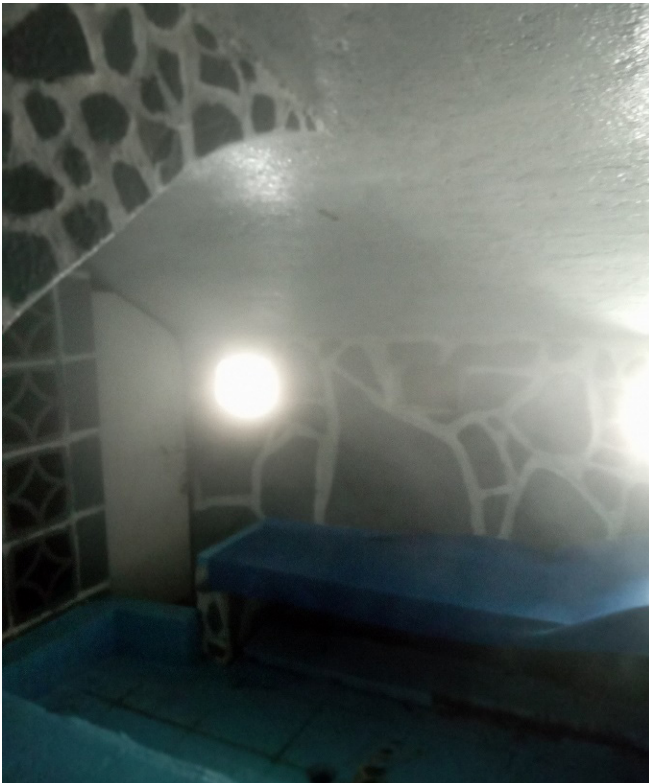
Figura 7. Interior de temazcal, vapor, Amatlán