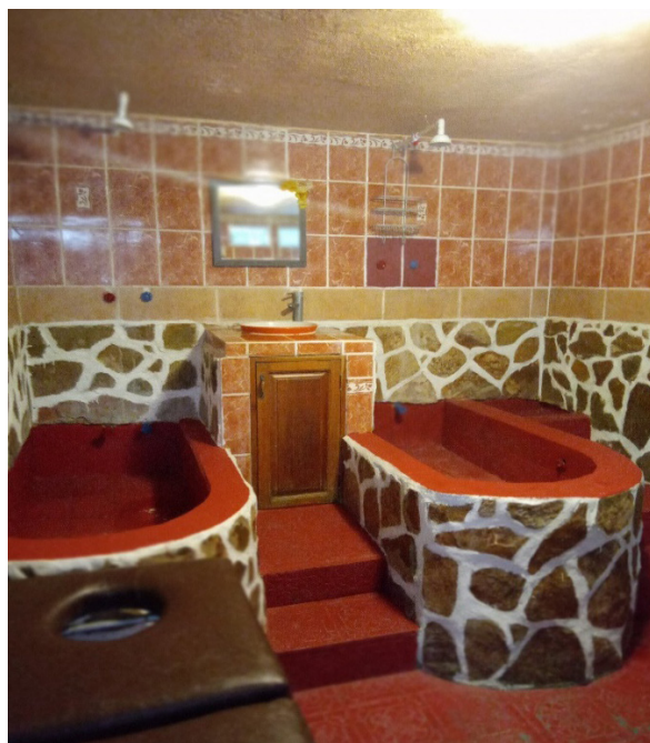
Figura 8. Habitación de masajes, Amatlán, Byron García, 2022

Yo utilizo mucho este tipo de terapias porque tengo muchos problemas de comportamiento y mis emociones [...] yo prefiero este tipo de ejercicios porque la medicina de la farmacia no me hace bien. Mi familia me ha ayudado en estos ejercicios porque me ayudan a estar mejor [...] yo lo hago cada fin de semana [...] aunque con la pandemia un poco menos porque también mi trabajo se vio afectado [...] pero de hecho yo uso el temazcal y los baños de acá porque estoy en serenidad cuando estoy en mis oraciones [...] dependerá de qué es lo que uno cree [...] pero a mí me ayuda porque hasta masajes hay ahora acá [...] cuando tengo muchos problemas en mi vida [...] me gusta poder retirarme y estar sola [...] dentro del agua caliente y luego fría [...] me conecto conmigo y siento que todo lo malo se queda en el agua y se va [...] no sabía que tiene un nombre especial yo solo lo hago porque he visto cómo me funciona. (C. M. Sánchez, comunicación personal, septiembre, 2022).