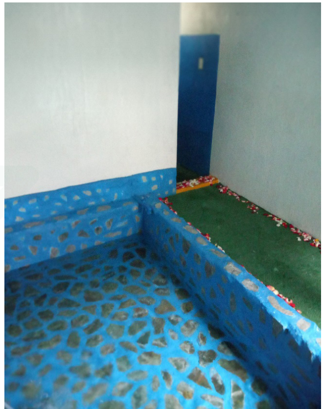
Figura 9. Baños de vapor con pétalos de rosa para meditaciones, Amatitlán, Byron García, 2022

Es una técnica [...] una terapia que estoy practicando, que me ha ayudado ya hace varios años [...] como una tradición familiar. Mi mamá fue la que me enseñó, veníamos con ella [...] ella nos trajo, nos introdujo. Son métodos ancestrales, pero con las nuevas formas se ha podido complementar bastante bien [...] yo vengo acá a los baños no solamente a desestresar el cuerpo sino también a tratar todo lo emocional [...] yo lo he practicado como una terapia de relajación que me ayuda a liberar estrés emocional, todas las situaciones negativas que puedan haber y que esto repercute en dolencias físicas [...] ya que toda dolencia física es siempre con trasfondo emocional [...] pero al estar dentro de un temazcal como baño de vapor y se hace este contraste ayuda mucho a relajar la mente.