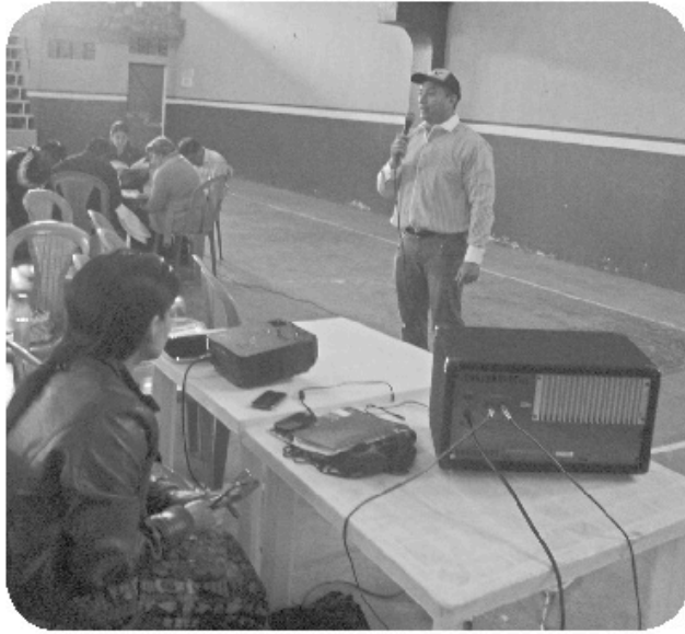
El investigador proporcionando información a los participantes.