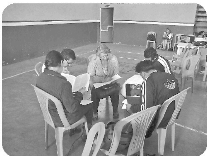
Uno de los equipos con más experiencia docente.