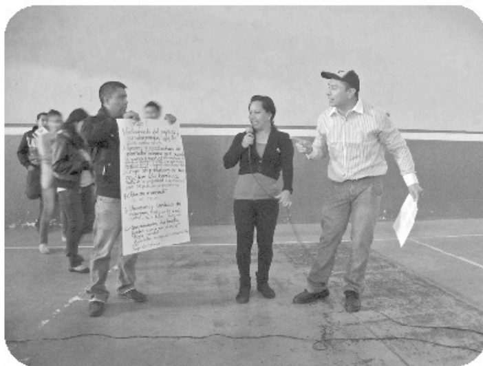
Los participantes exponiendo sus respuestas.