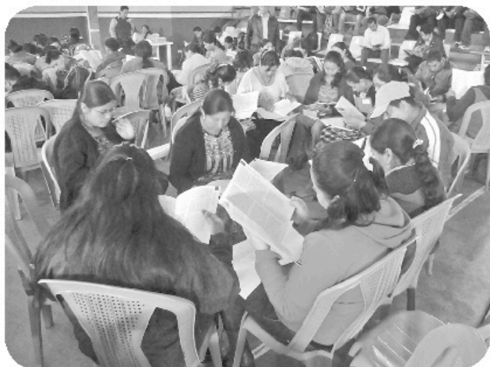
Docentes durante el proceso de lectura.