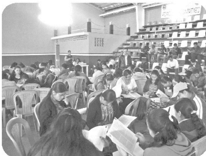
Asesoría a los participantes.