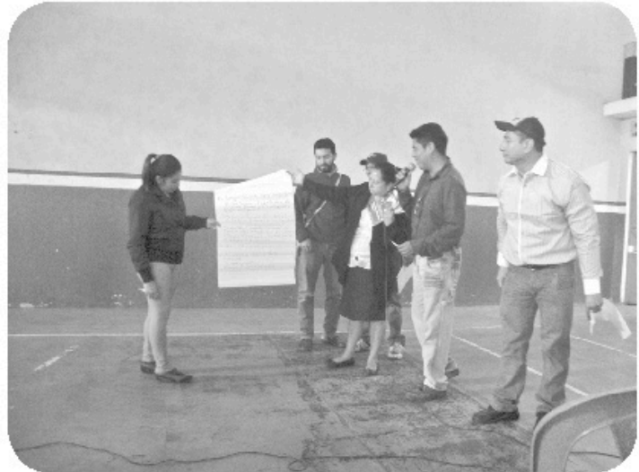
Otro grupo de participantes durante la puesta en común.