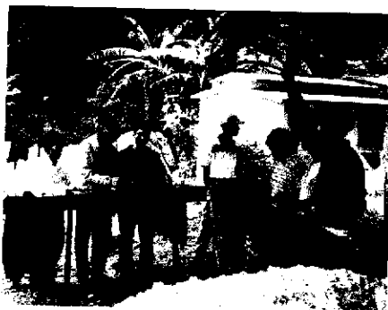
Fig. 1. Músicos de marimba tocando en el panteón de Guadalupe Victoria, durante todos santos.

sobrepuesto casi totalmente a esta celebración) y la conmemoración de la obtención del tejido.