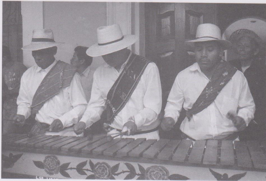
Marimbistas de la emia k'iche' tocan sones sagrados en una marimba sencilla, voz que identifica al pueblo maya.