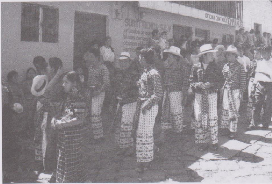
Pobladores de Sololá se reúnen en la casa comunal.