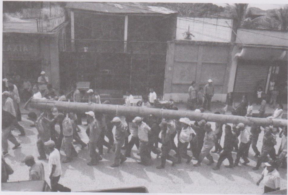
Hombres de Rabinal portan el palo volador que va ser insertado al frente de la iglesia para los ritos sagrados de este baile que tiene cientos de años en los rituales mayas.