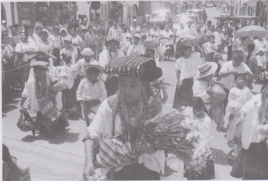
Indígenas de la etnia Mam caminan hacia el mercado y casas de cofradías.