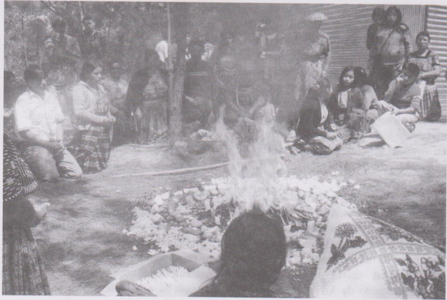
Ceremonia maya que con sus rituales unifican lo sagrado y lo profano.