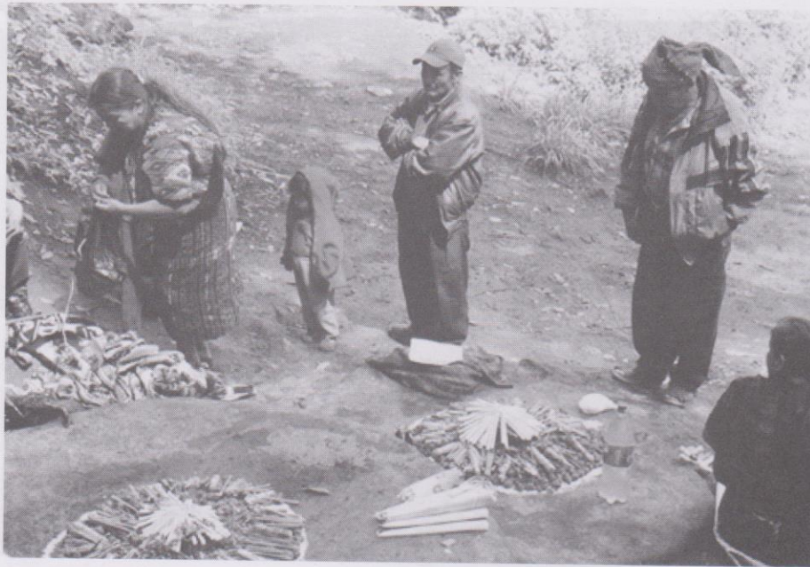
Guías espirituales preparan un ritual maya en un sitio sagrado de la región k'iche'.