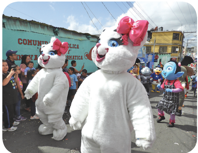
Figura 8. Marie, personaje de los Aristogatos (1970), forma parte de un convite estilo peluche enfocado hacia el público infantil. (Castro).