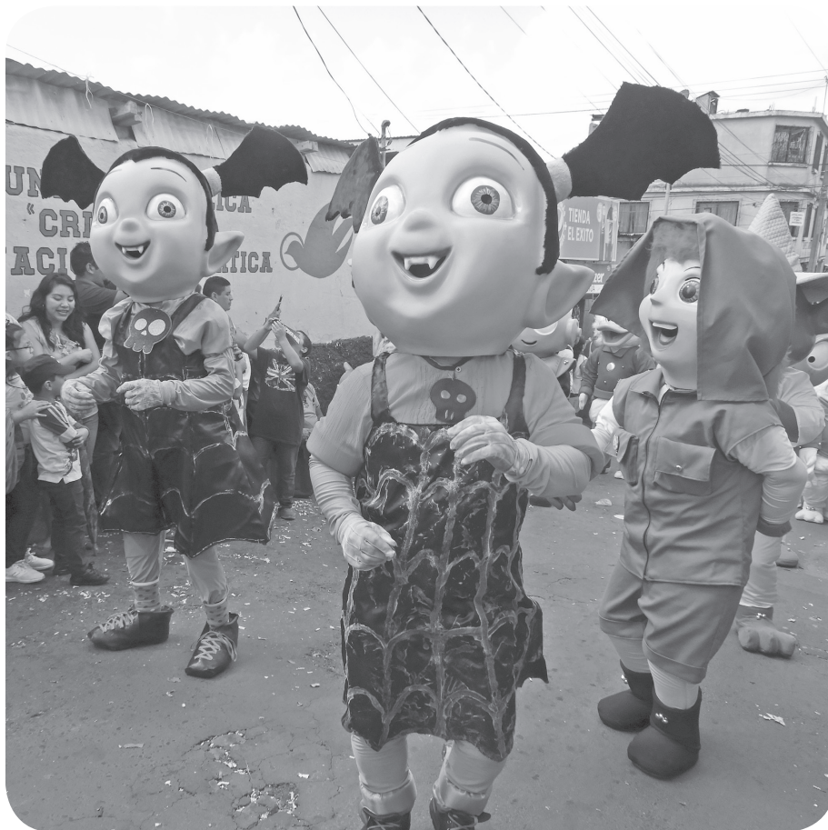
Figura 6. Vampirina, uno de los dibujos animados más recientes enfocado hacia los niños de corta edad. (Castro).