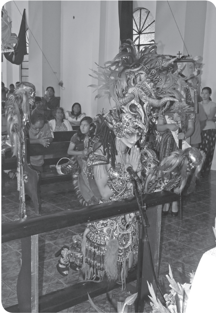
Figura 3. Bailadora del convite Santa Cruz del Quiché ora frente a la imagen de Santo Domingo, para suplicar su bendición durante el recorrido. (Castro).