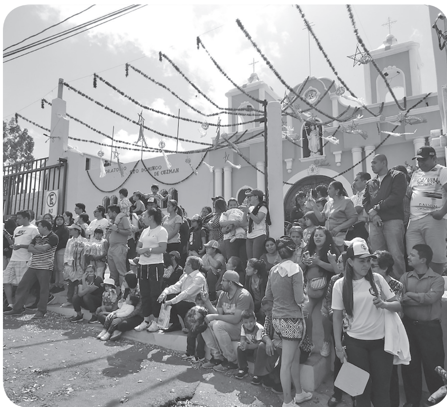
Figura 1. Público observa el paso de un convite frente a la cofradía de Santo Domingo de Guzmán. (Castro).