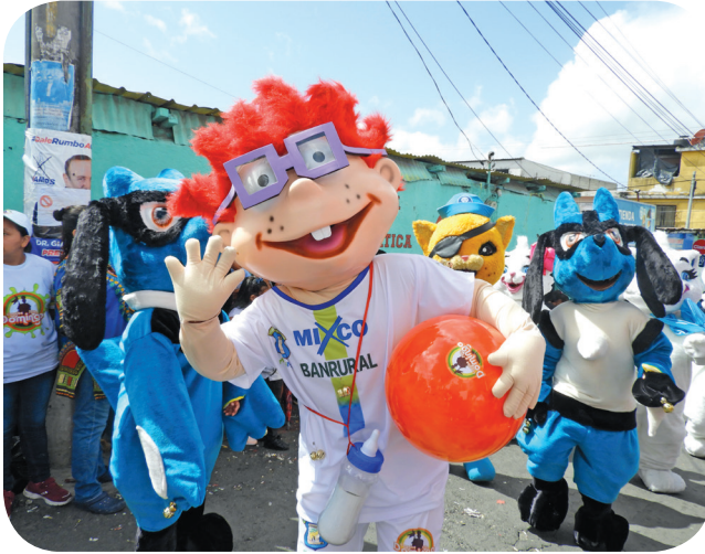
Figura 7. Carlitos de los Rugarats baila en las filas del convite Nuevo Santo Domingo, serie animada de 1991 a 2004. (Castro).