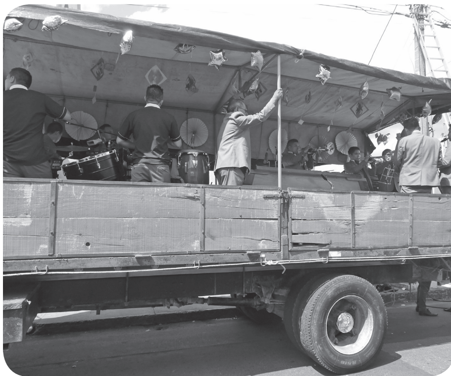
Figura 2. Camión traslada a los músicos que amenizan la marcha de un convite en las calles mixqueñas. (Castro)