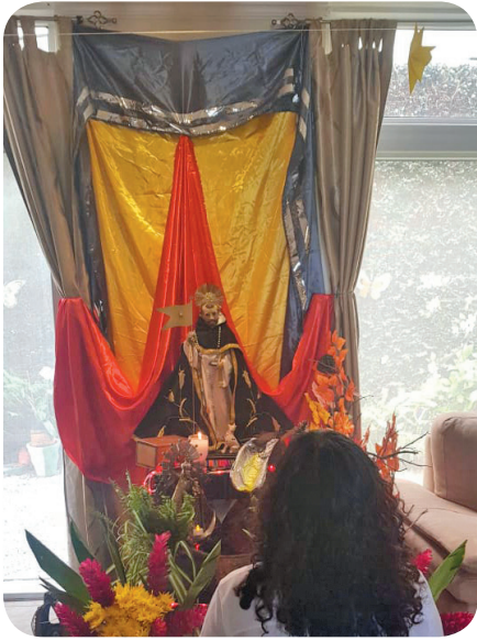
Figura 11 Imagen de la fe y devoción de las personas a la imagen de Santo Domingo. (García).