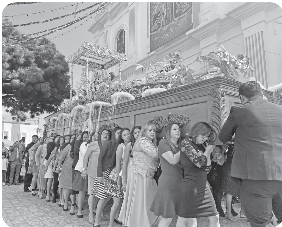
Figura 3 Imagen devotas y devotos fieles de la Virgen de Morenos (Mansilla).