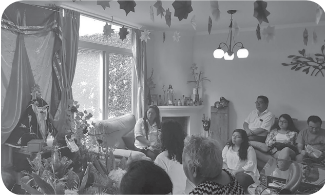
Figura 15 Imagen de los fieles al recibir la imagen de Santo Domingo en los hogares. (García).