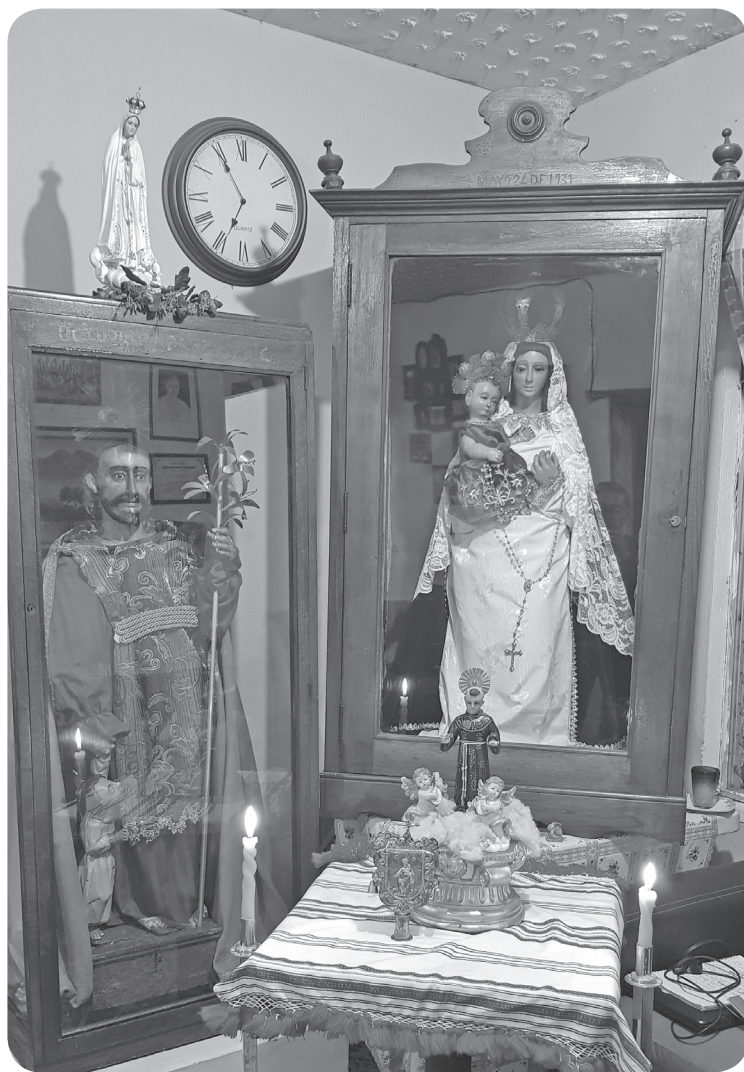
Figura 17 Altar de la Virgen del Rosario y San José en la casa del Cofrade Mayor. (García).