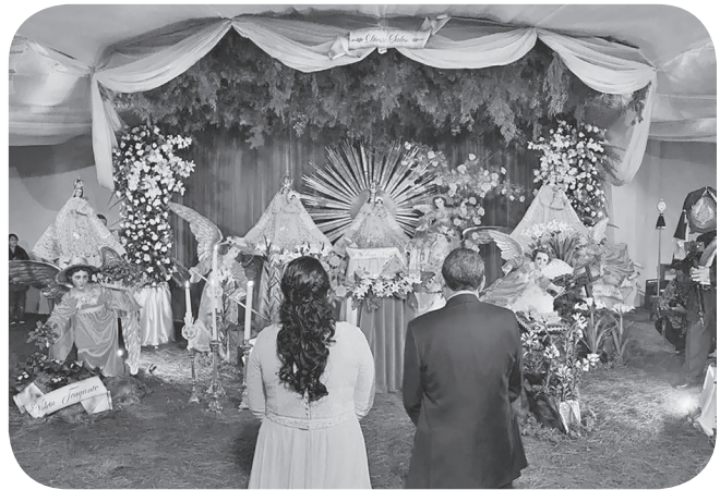
Figura 8 Imagen del altar particular preparado en la casa de las capitanas y tesoreros de la Virgen de Morenos. (Mansilla).