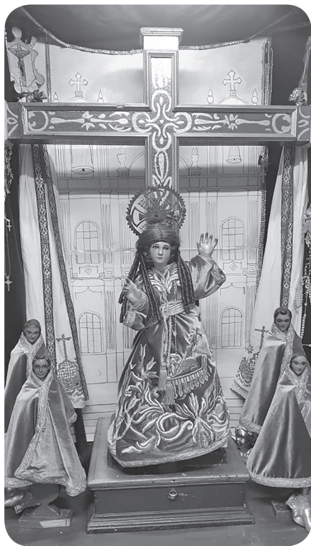
Figura 13. Imagen del Niño de la Santa Cruz. (García).