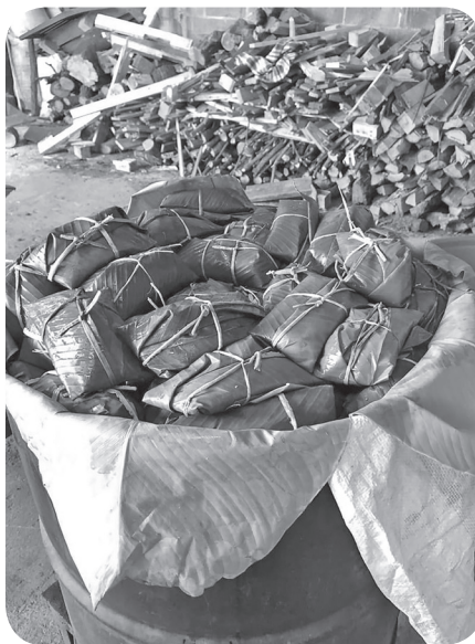
Figura 6 Imagen de tamales preparados para la celebración de la Virgen de Morenos (Mansilla).