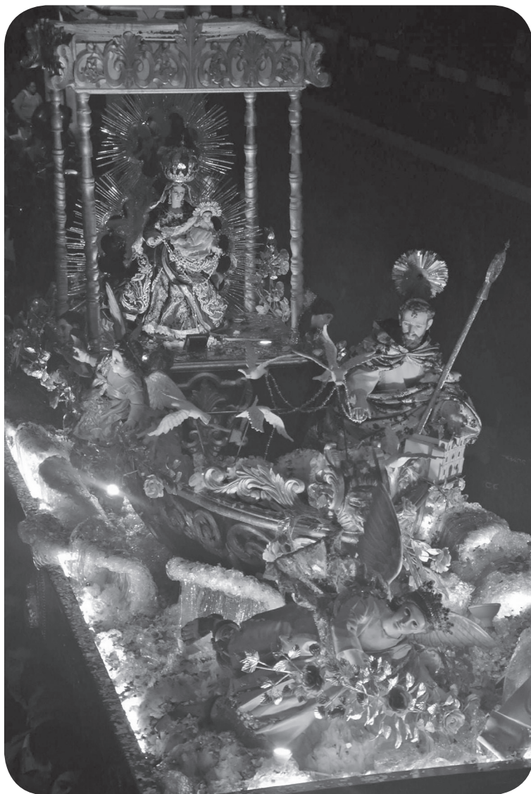
Figura 24 Santo Domingo y la Virgen de Morenos, santos patronos de la Ciudad de Mixco. (Portillo).