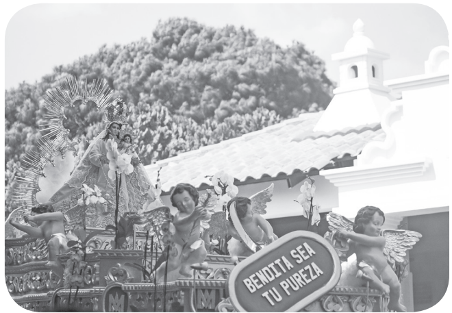
Figura 2 Imagen del recorrido procesional por las calles de la ciudad. (Mansilla).