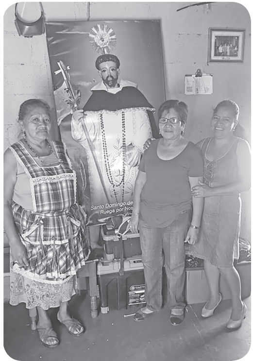
Figura 16 Imagen de las Hermanas Yantuche fieles colaboradoras y cocineras del caldo colorado el cual se sirve para las festividades de Santo Domingo. (García).