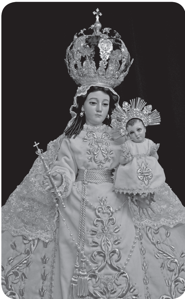
Figura 23 La Virgen de Morenos luego de la más reciente restauración. (Portillo).