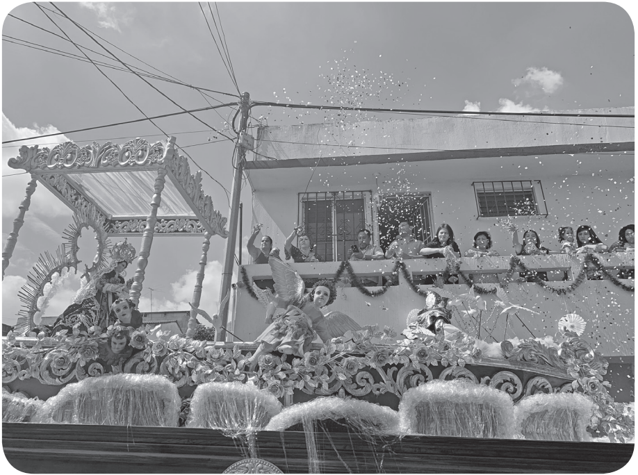
Figura 4 Imagen de los fieles celebrando la Fiesta Titular en honor a la Virgen de Morenos (Mansilla).