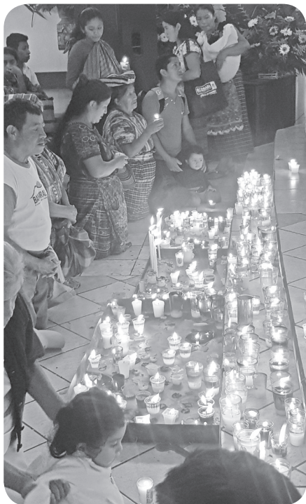
Figura 19 Devoción mixqueña observada en la aldea Lo de Bran. (García).