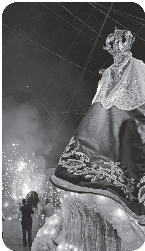
Figura 21 Pólvora presente en las festividades de la Virgen de Morenos. (Portillo).