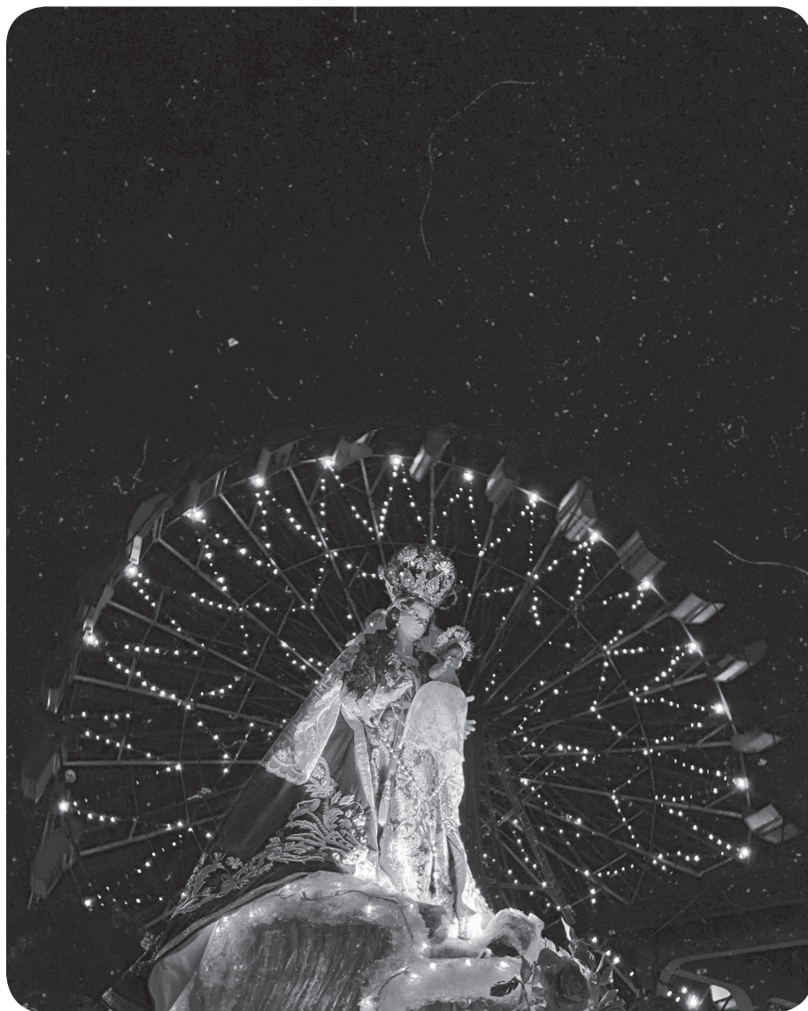
Figura 22 La Feria en honor a la Virgen de Morenos. (Portillo).