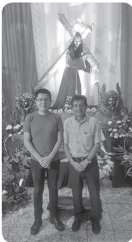
Figura 14 Imagen de los dirigentes del Señor Nazareno Perpetuo protector de la Ciudad de Mixco. (García).