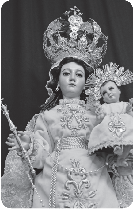
Figura 1 Imagen Virgen de Morenos (Mansilla).