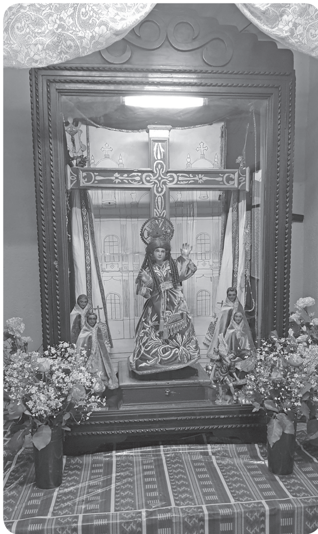
Figura 18 Altar del Niño de la Santa Cruz, en la casa de la presidenta de la Cofradía. (García).