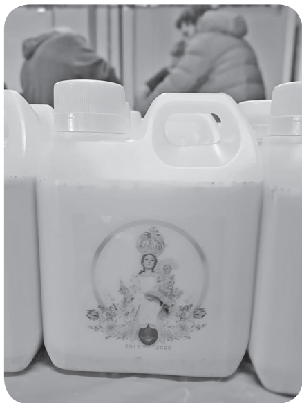
Figura 5 Imagen bebida de horchata servida para la bienvenida y las visitas de la Virgen de Morenos en los diferentes hogares del la ciudad de Mixco. (Mansilla).