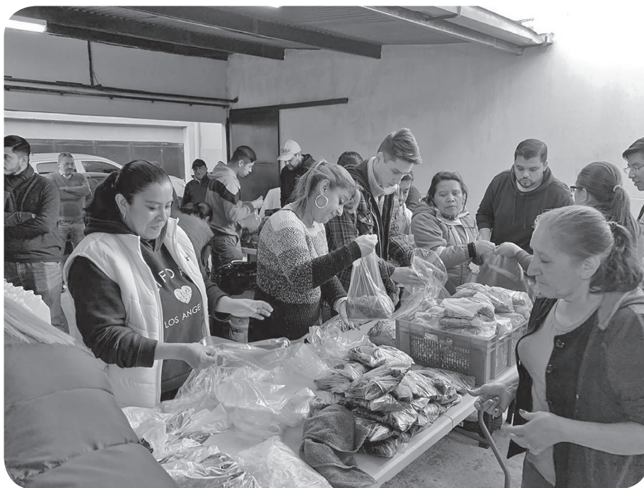
Figura 26 Reparto de tamales en los festejos de la Virgen de Morenos. (Mansilla).