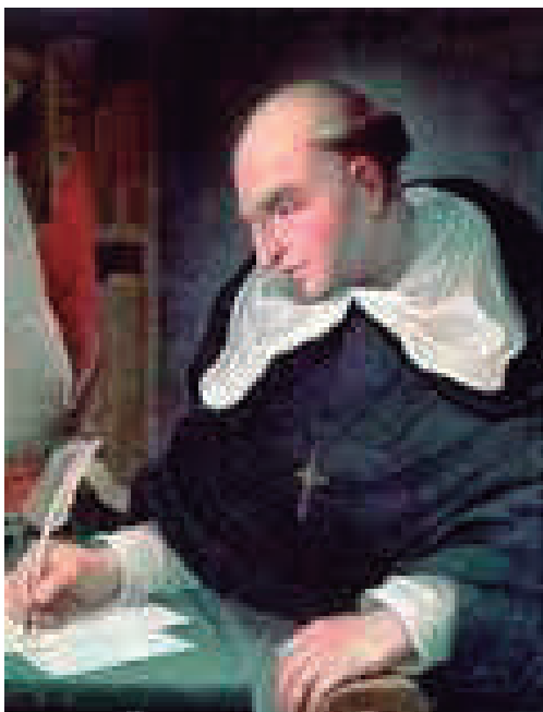
2. Fray Bartolomé De Las Casas Defensor de los indígenas.

y sus rentas disminuyen; España, tan necesitada ahora de auxilios, no recibe ninguno. Dios está ofendido por los pecados de los españoles y España en peligro de perderse y ser robada por los turcos y moros. Además, las noticias de la crueldad y desmanes de los españoles en Indias llegan a todo el mundo, con perjuicio de la fama española.