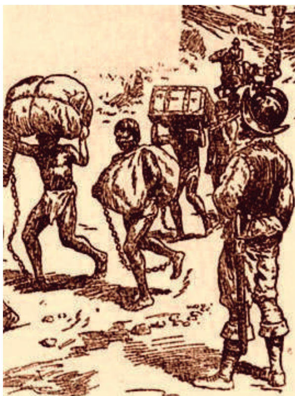
1. Imagen del trabajo forzado implementado por los españoles.