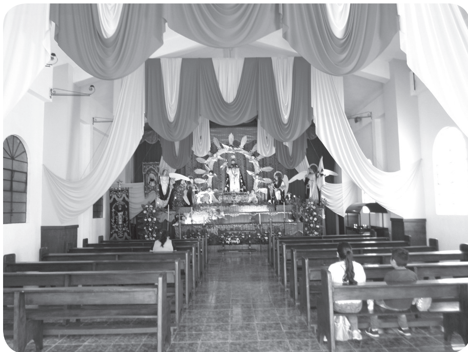
Figura 3 Interior de la capilla de la cofradía de Santo Domingo de Guzmán. (Solórzano).