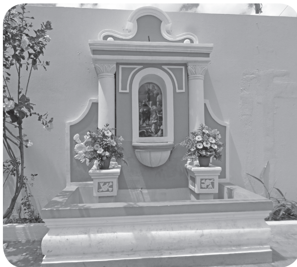
Figura 6 Búcaro construido en el año 2019, en el atrio del oratorio de la cofradía de Santo Domingo de Guzmán. (Solórzano).