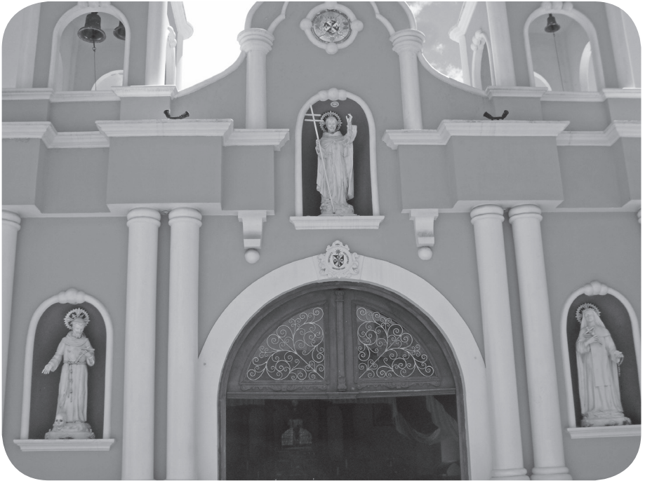
Figura 2 Capilla u oratorio de la cofradía de Santo Domingo de Guzmán, ubicado en la zona 1 de Mixco. (Solórzano).