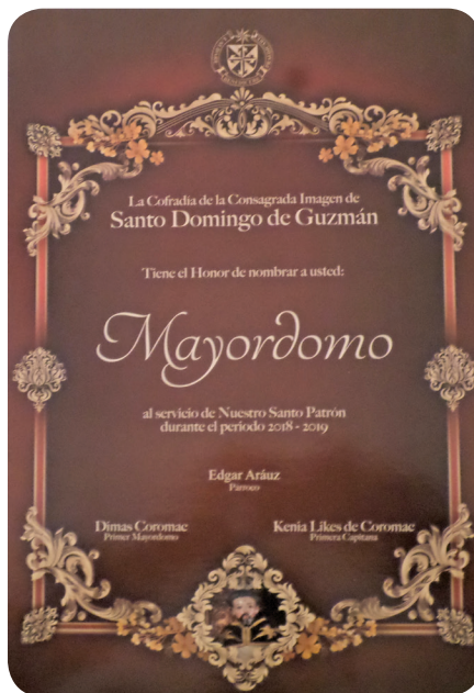
Figura 10 Constancia que se les entrega a los Mayordomos nombrados de la cofradía de Santo Domingo de Guzmán. (Solórzano).