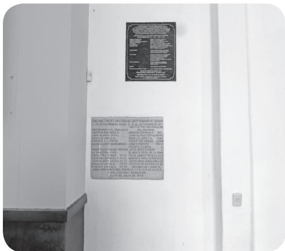
Figura 5 Placa conmemorativa en la que se consigna que de 2012 a 2013 se realizaron trabajos de construcción en la fachada del templo u oratorio de la cofradía de Santo Domingo de Guzmán. (Solórzano).