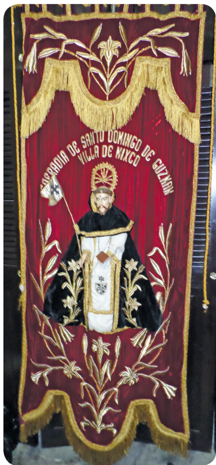
Figura 9 Estandarte de la cofradía de Santo Domingo de Guzmán, el cual está a cargo de las capitanas. (Solórzano).