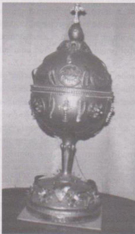
Ilustración 9. Copón ornamental realizado por el maestro Luis Alberto de León en duroport, con incrustación de piezas de bisutería que por su valor artístico puede alternar con esculturas antiguas sin desmedro de su presentación final. Fotografía Fernando Urquizú, año 1996

El manejo de este tipo de esculturas es muy valioso en la actualidad en la medida que contribuye fundamentalmente a mantener el sentido de "totalidad artística" que no pierde detalle en aspectos puntuales de la presentación final de las obras que a la vez sirve de material de resguardo de piezas originales que expuestas en altares visitados por multitudes donde también se cuelan personas no creyentes interesadas en el despojo del patrimonio cultural de nuestro país en el que solo aprecian su valor comercial.