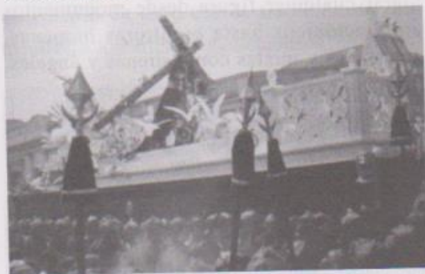
Ilustración 4. Anda de la procesión de Jesús Nazareno de la iglesia de La Merced de la Nueva Guatemala de la Asunción decorada con el tema "Señor danos la Paz" realizada en un ochenta por ciento en duroport que se presento en color de fábrica. Alternó motivos arquitectónicos con esculturas de doce palomas en actitud de vuelo de tamaño natural.

Las aves salían de los pies de Cristo representado en la escultura de Jesús Nazareno, completó la ornamentación dos barandales de tipo arquitectónico y un atril con un libro abierto donde destacaban las letras Alfa y Omega significando el principio y el fin de los tiempos contenidos en el Evangelio, que como código de vida de los cristianos siempre encontrarán en este escrito la verdad y la vida, expresadas en la parte superior de sus hojas abiertas con la escultura de otra paloma que llevaba en su pico una rama de olivo que alude de manera iconológica e iconográfica a lo descrito anteriormente.