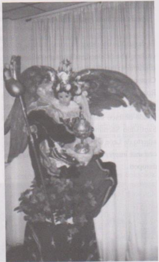
Ilustración 7. Escultura de San Gabriel de finales del Siglo XIX ataviado para altar de Cuaresma y Semana Santa con atributos iconográficos realizados en duroport. (año 1994)

La incorporación del uso del duroport en la alfarería tradicional guatemalteca como principal material de trabajo trajo como consecuencia su utilización en la reposición de partes de obras de arte procedentes del periodo de la dominación española. Este uso también se le debe al artista Luis Alberto de León que lo comenzó a utilizar para la confección de alas para ángeles de todo tamaño originalmente en blanco como hemos citado anteriormente, sin embargo, en la última década del Siglo XX este uso comenzó a estudiarse y adaptarse para completar obras con un carácter de expresión propio que da una optima presentación a estos personajes.