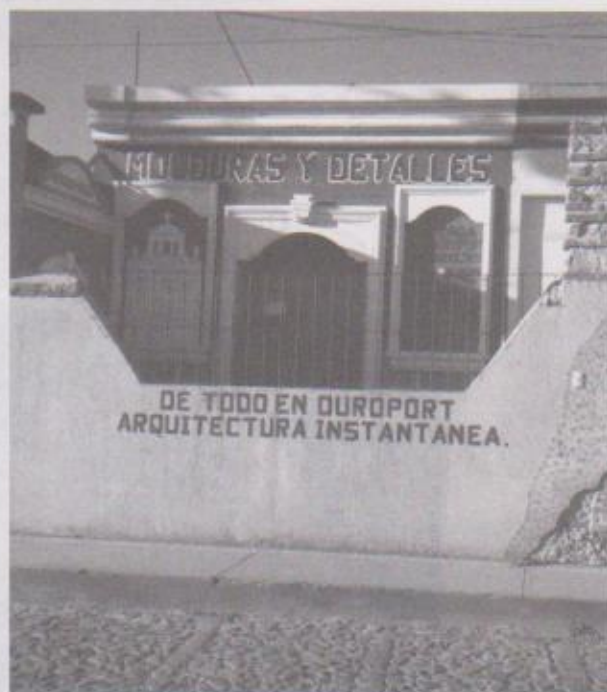
Ilustración 11. Venta de obras de arte y ornamentos arquitectónicos de duroport en La Antigua Guatemala

En el desarrollo de este material es interesante destacar que actualmente existen tiendas especializadas dedicadas a la venta de diferentes artículos elaborados en duroport en donde se puede adquirir distintos objetos decorativos de este material o bien mandar a confeccionarlos de acuerdo a requerimientos preestablecidos.