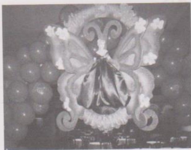
Ilustración 2. Coronamiento de arco de globos para una fiesta de 15 años en un salón de los viejos barrios de la Nueva Guatemala de la Asunción que se reviste de gala con este tipo manifestaciones del arte popular elaborado en duroport.

En este contexto el duroport también extendió como materia prima en la confección de todo tipo de ornamentos para cualquier tipo de festividad, actualmente son muy populares los adornos de Quince Años a los que se les agregan otros materiales como brillantina, piedras de materiales plásticos para simular joyas y telas.