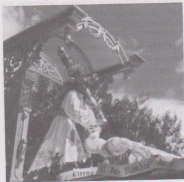
Ilustración 5. Adorno que lució el anda de Jesús Nazareno de la iglesia de la Merced el Viernes Santo 17 de abril de 1981 con el tema "Eterno sea el Dulce Nombre de Jesús" realizado en más del ochenta por ciento en Duroport por el artista Luis Alberto de León, donde ya es evidente un estilo propio en el trabajo de este material. (Fotografía álbum del artista Luis Alberto de León.)

La escultura de Jesús Nazareno fue colocada bajo en templete que alternó de manera equilibrada la altarería tradicional con una moderna que no rompió del todo con su predecesora, materializándose así, un nuevo tipo de obra que podemos llamar propiamente ya del estilo del artista que con este tipo representaciones arquitectónicas, creó otra corriente de expresión utilizando un material y técnica de trabajo propia, quizá única en el mundo.