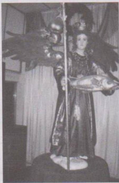
Ilustración 8. Escultura de San Rafael en donde podemos apreciar la confección de sus atributos con esculturas de duroport como se puede apreciar en el tecomate del báculo y el pescado.

El uso del duroport en las alas de los ángeles dio lugar a la elaboración de elementos iconográficos e iconológicos propios para en la restitución del discurso visual de las esculturas originales con un material que bien tratado puede apoyar perfectamente el proceso de restauración del las imágenes antiguas en su función original de material didáctico de la evangelización o bien completar el decorado de las iglesias. El uso del duroport en este aspecto reduce considerablemente los costos en devolución a la apariencia original de las imágenes, sin embargo,