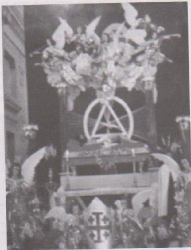
Ilustración 3. Altar de Velación del Señor Sepultado del templo de La Recolectión de la Nueva Guatemala de la Asunción a principios de la década de 1970 cuando se utilizó el duroport por primera vez en la elaboración de alas de ángeles de distintos tamaños; así como capiteles de columnas, motivos heráldicos y el catafalco del Señor.

La presentación de los ángeles fue completada con esculturas arquitectónicas de capiteles de columnas y motivos heráldicos que completaban el nacimiento de un nuevo tipo de altarería que no rompió de todo con la tradición de esta manifestación artística guatemalteca.