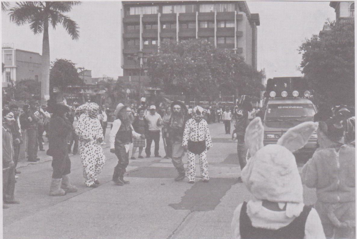
25. Convite en la ciudad capital para el 15 de agosto del 2005.

Es el momento entonces en que debido a estas influencias y a la inevitable imitación de lo que viene de fuera, (por la radio, el cine y la TV) que, los convites pierden toda la expresión heredada y se convierten en manifestaciones festivas y graciosas a la orden de la modernidad contemporánea que se transmite por las nuevas tecnologías de los Medios de Comunicación, cumpliendo así nuevas necesidades de expresión artístico popular de acuerdo con las nuevas dinámicas sociales provocadas por el aumento masivo de las poblaciones.