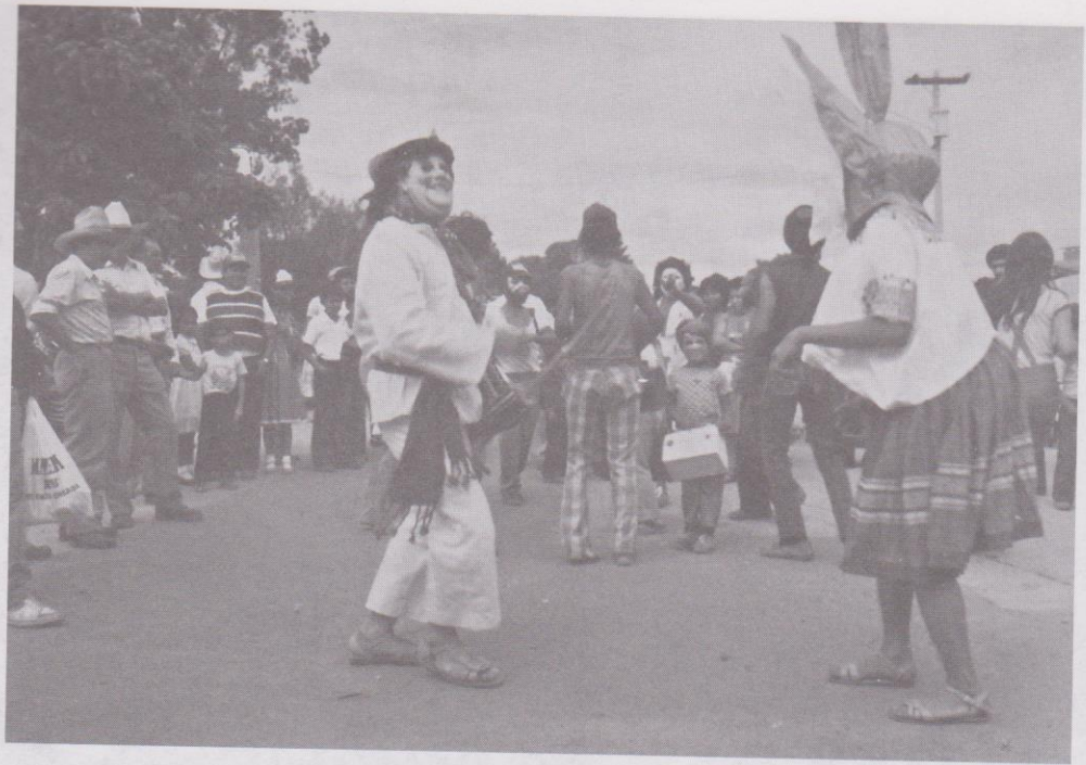
4. Indígenas bailando un son.