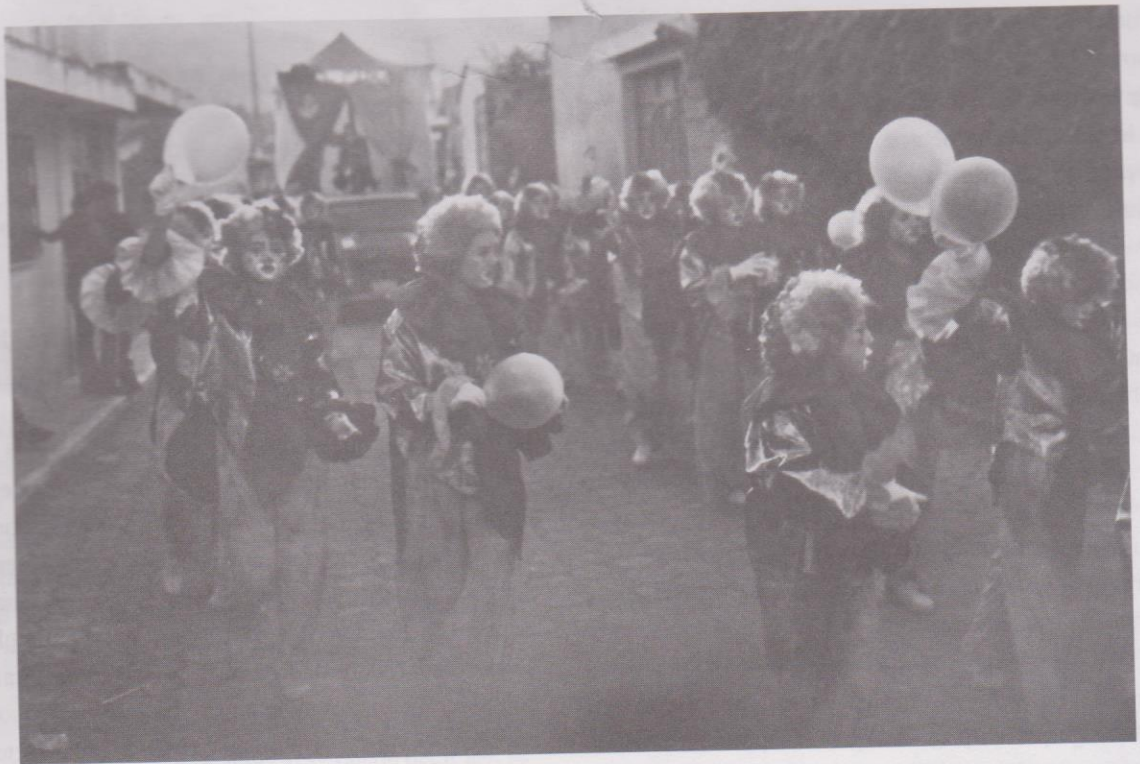
10. Disfraces homogéneos de payasos