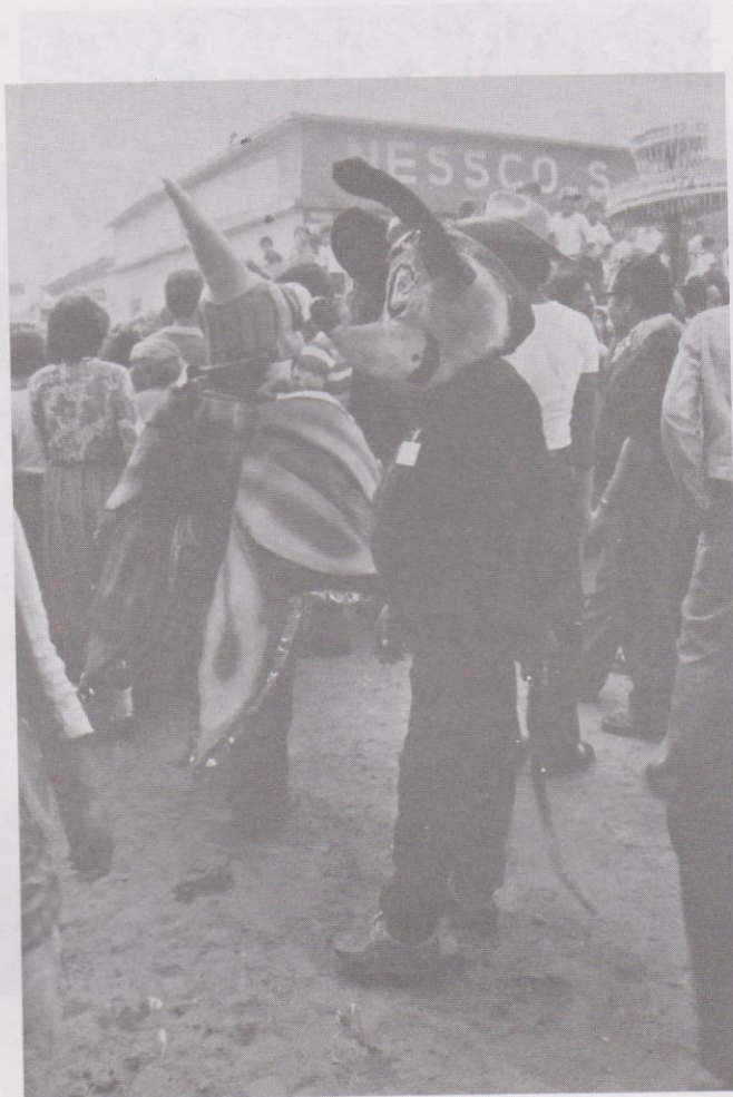
3. Personajes fáunicos