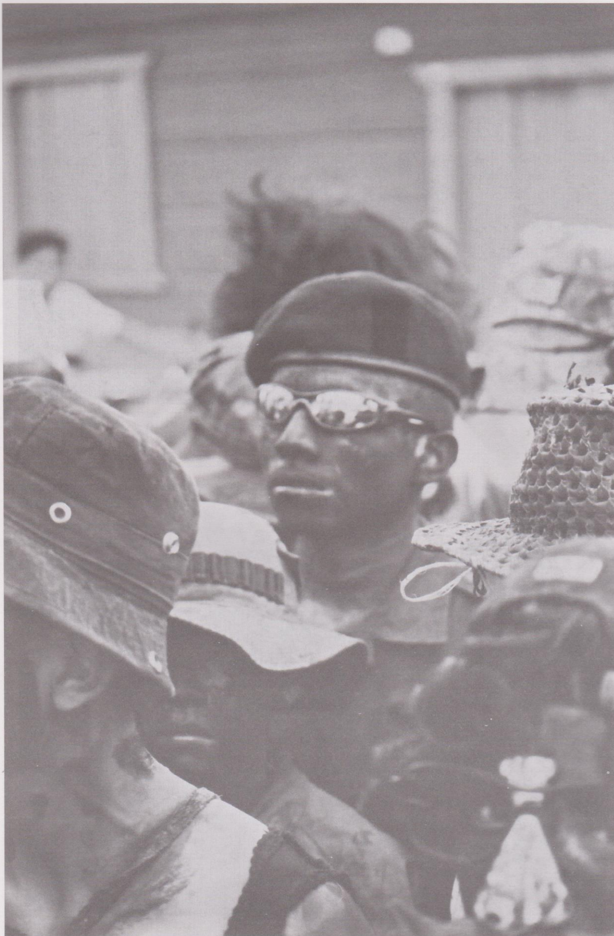
20. Fiero en el papel de kaibil