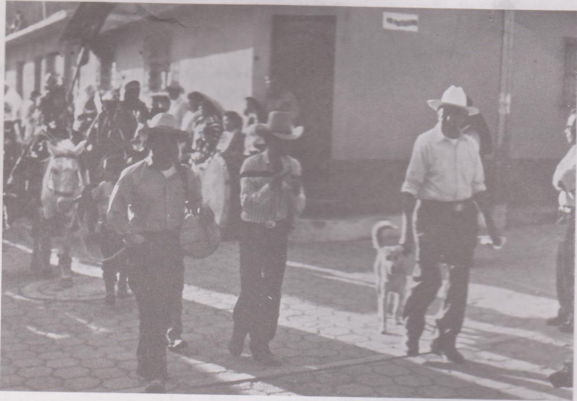
16. Ensamble de pito, tambor y caja, precediendo el rezado de Concepción junto con las niñas a caballo.