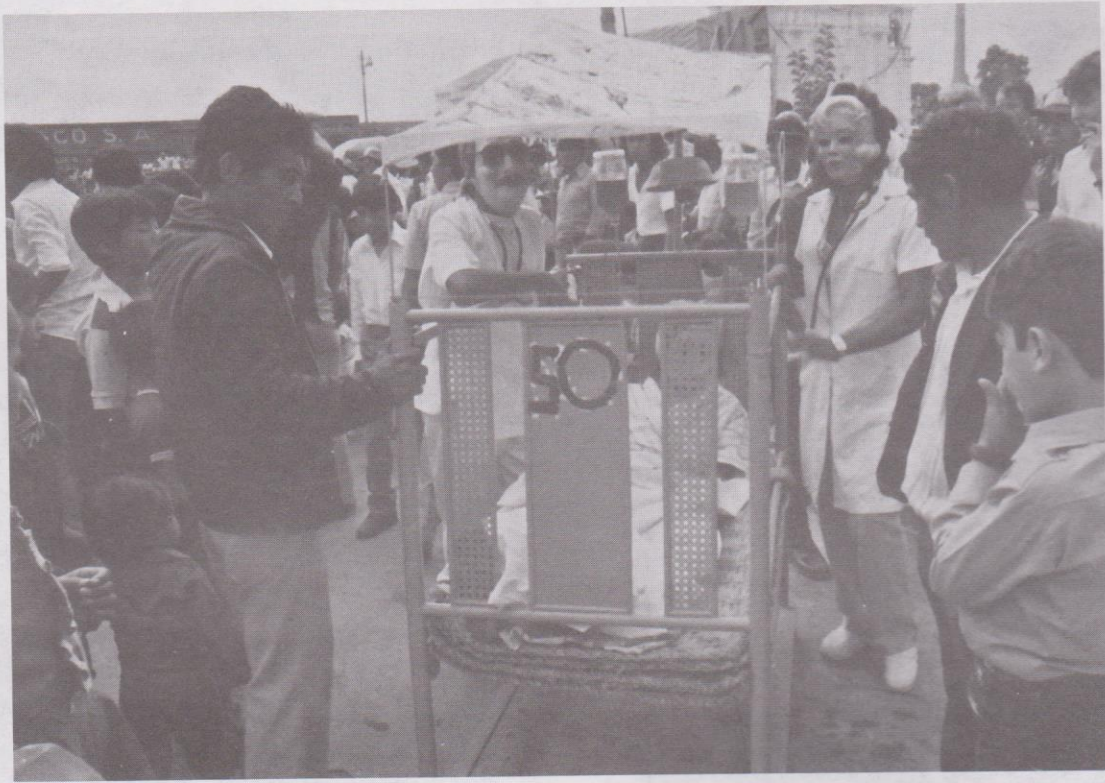
7. Servicio de enfermería