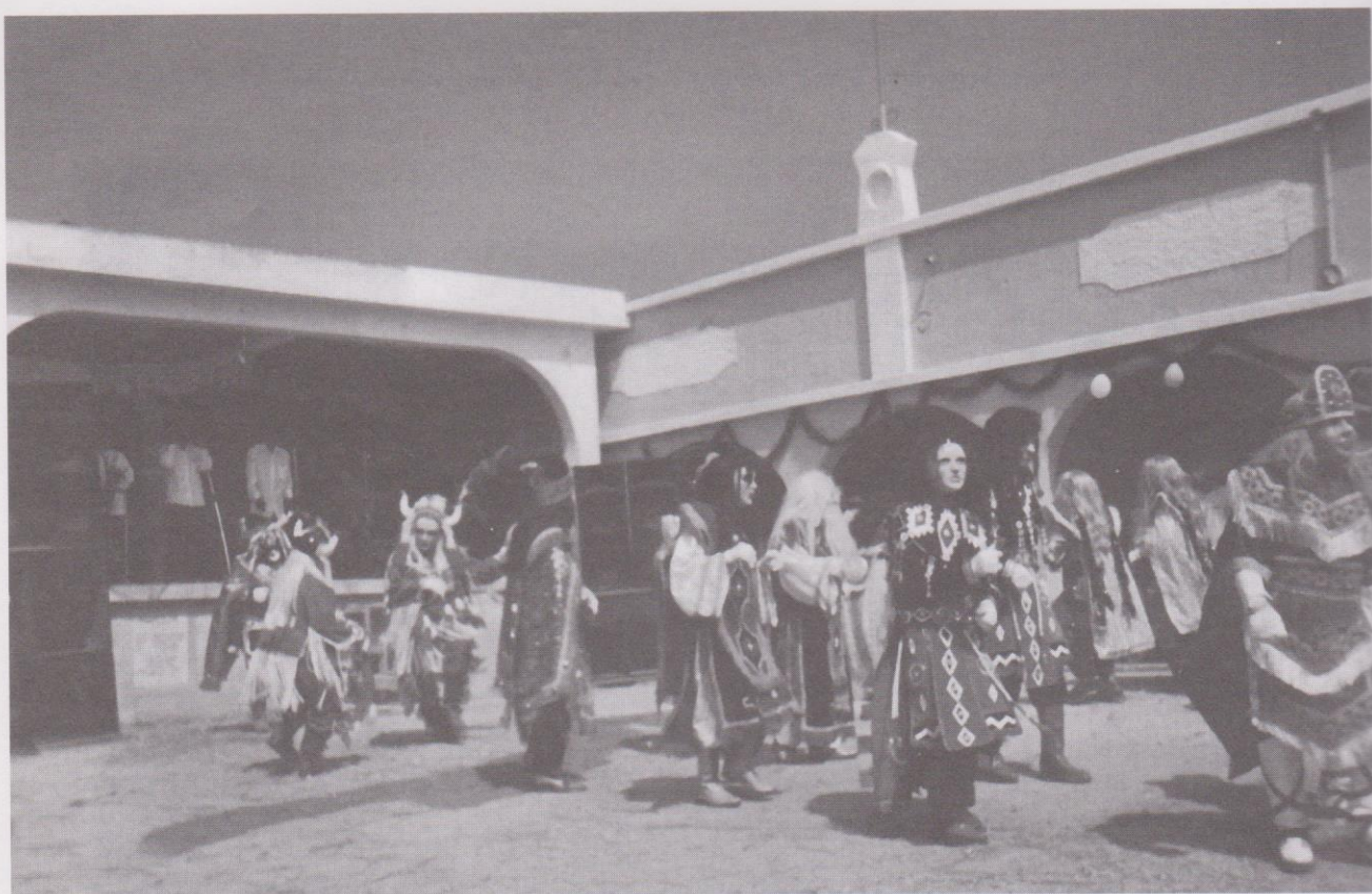
Convite de Santa Cruz el Quiche, El Quiche, el día patronal de San José, Aldea San José Nacahuil de San Pedro Ayampuc, 19 de marzo del 2005