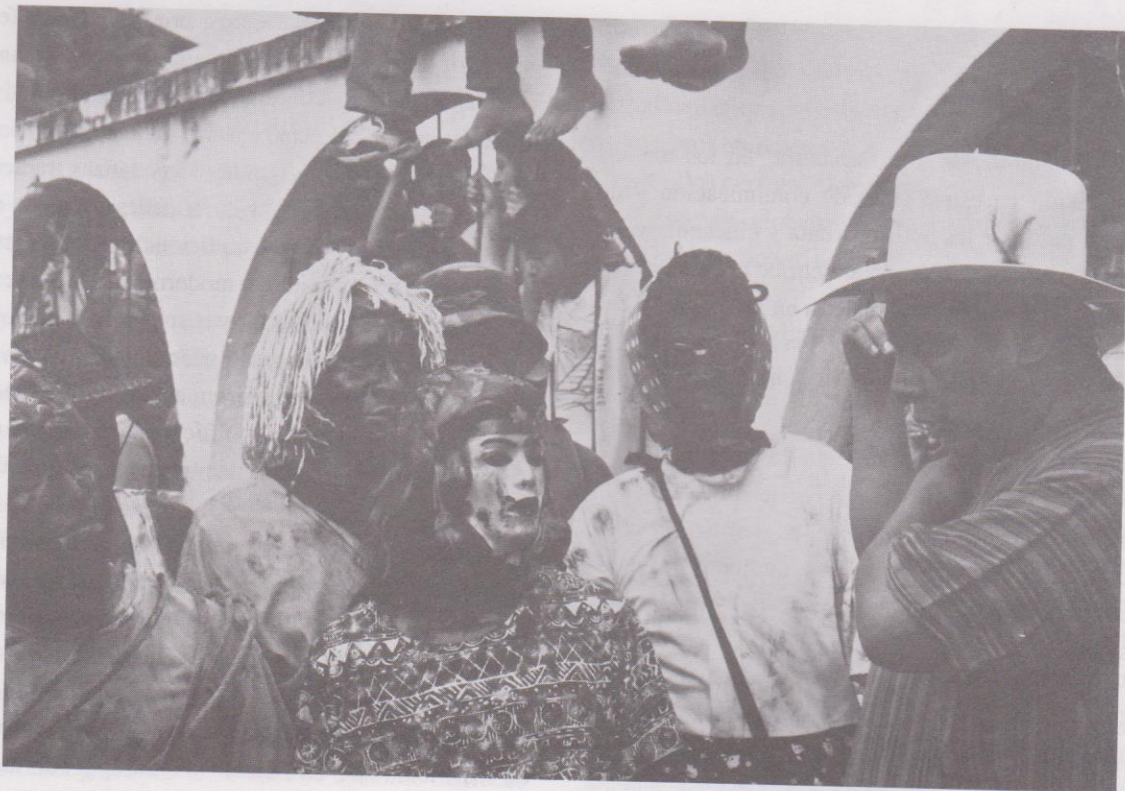
23. Fieros durante los preparativos antes de la salida oficial.