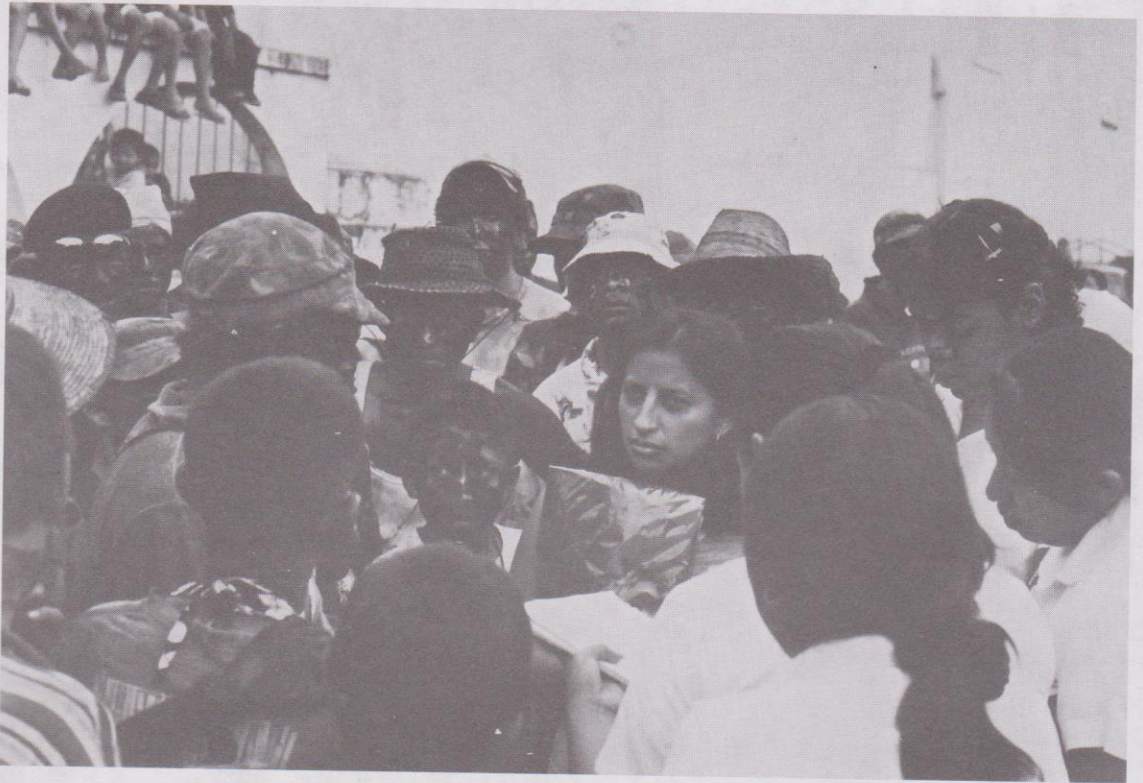
22. Fieros entrevistados por estudiantes de la localidad