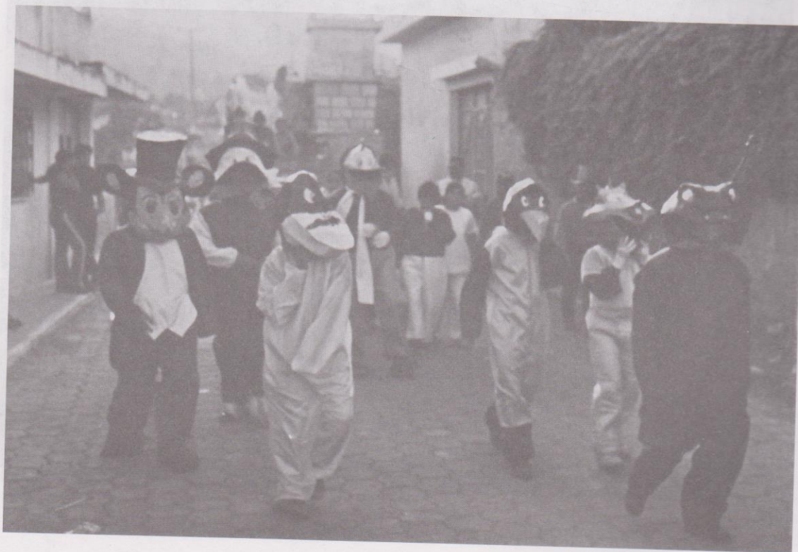
9. Disfraces fáunicos