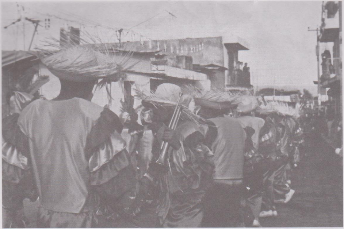
14. Disfraces de corte tropical