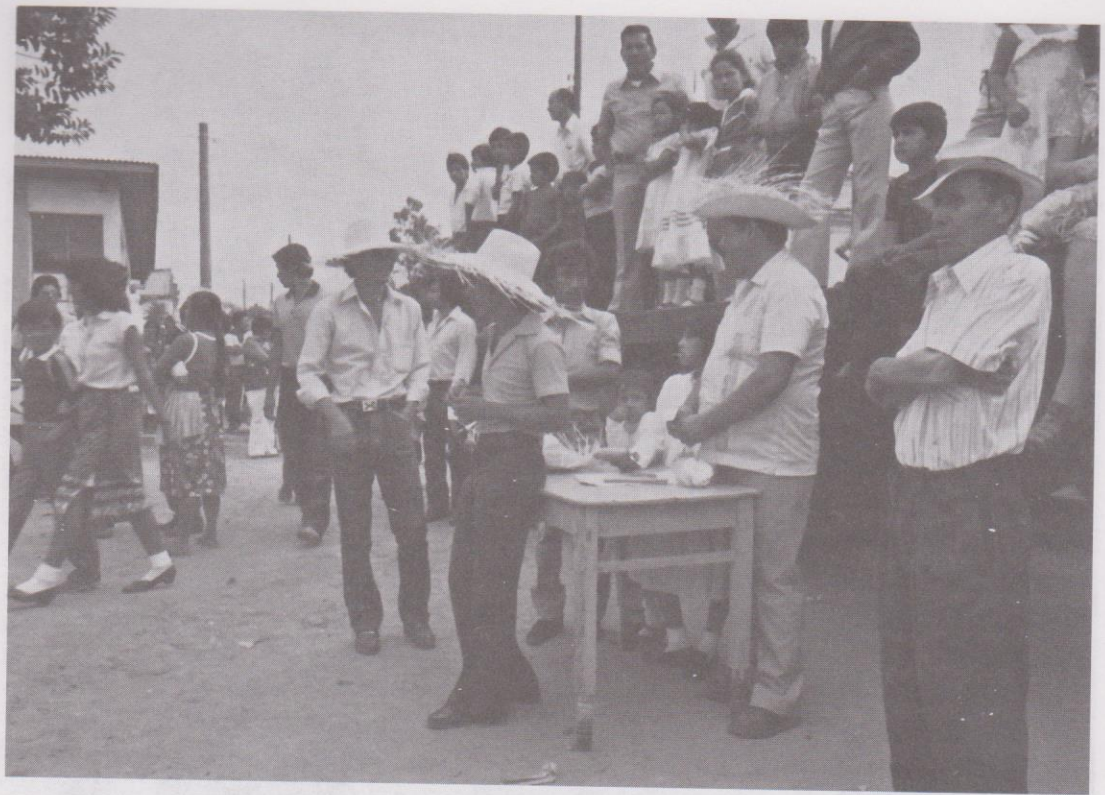
8. El Jurado Calificador