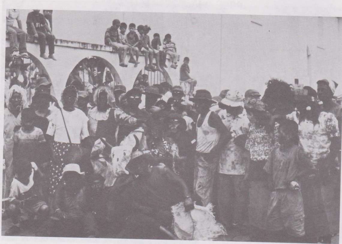
24. Los Fieros posando para nuestras cámaras.