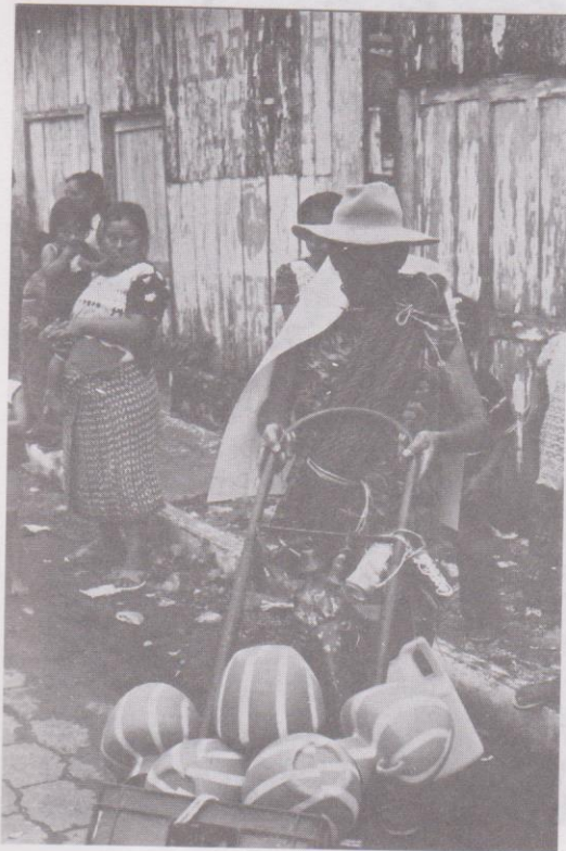
18. Personaje de la localidad.