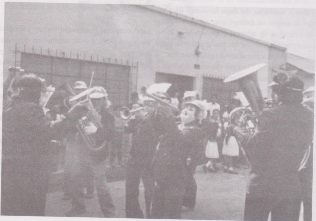
1. Banda de músicos

Este convite ostenta una antigüedad aproximada de 150 años. Se realiza durante el día 1 uno noviembre a más de un mes previo a las fiestas de Concepción villanovanas del 8 de diciembre. Actualmente participan centenares de personas disfrazadas.