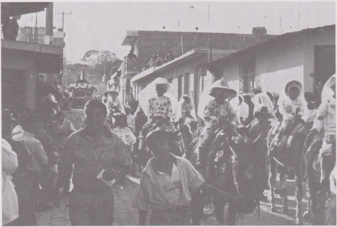
15. Niñas a caballo precediendo el rezado de Concepción