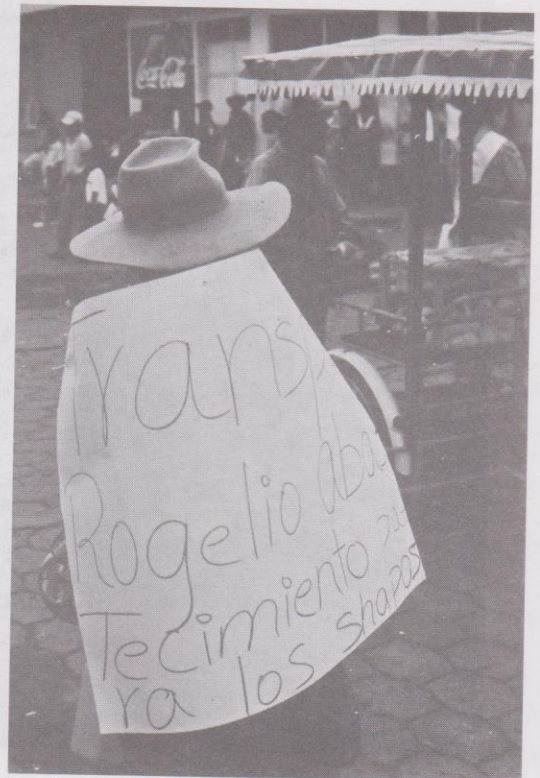
19. El mismo personaje.