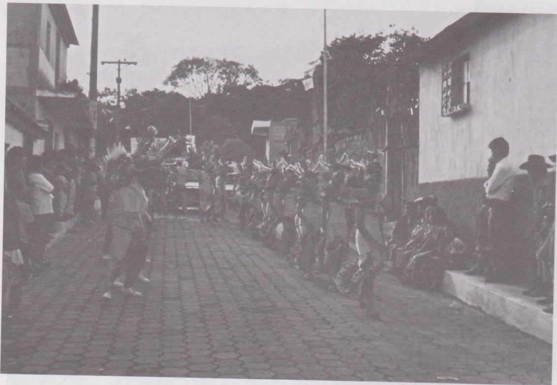
13. Disfraces de corte tropical