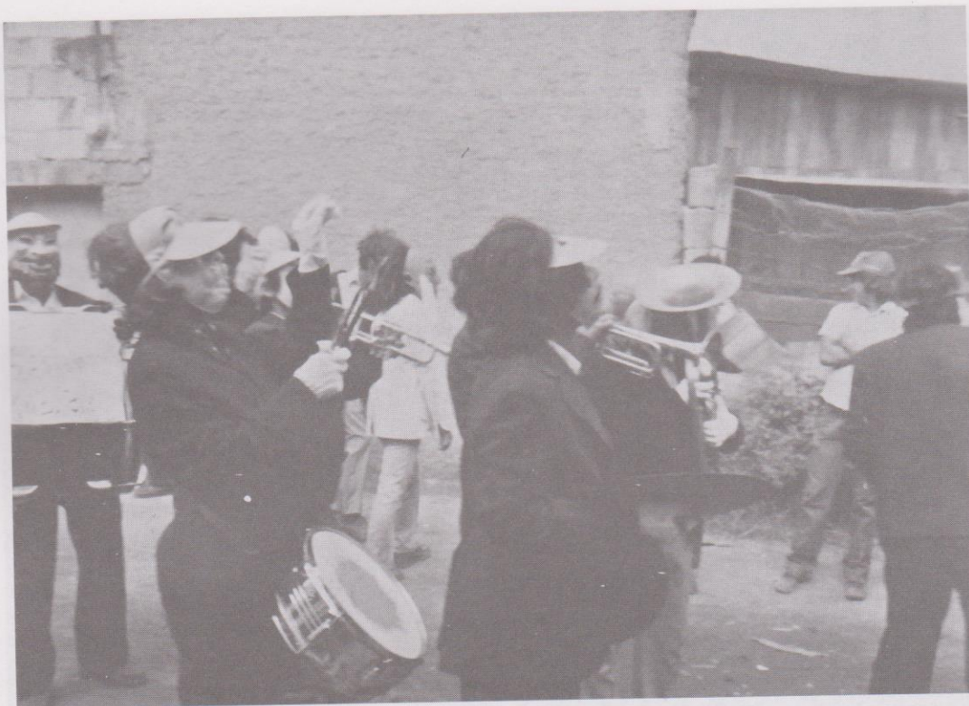
2. Banda de músicos