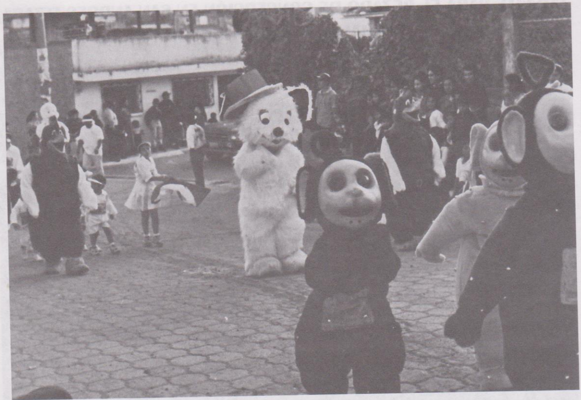
11. Más disfraces fáunicos acompañados de niños y niñas batonistas.