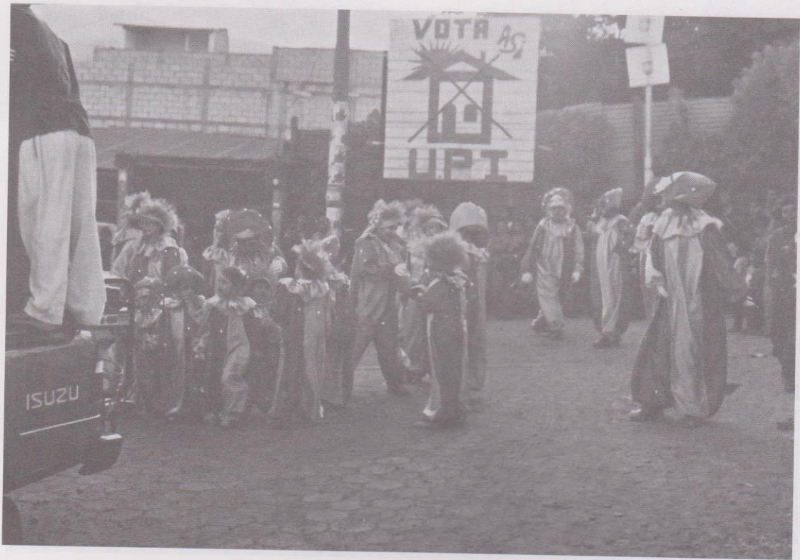
12. Disfraces de corte europeo