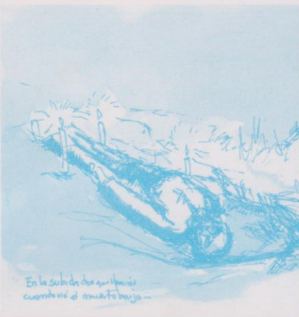
En la subida de aquí hasta cuando sé el minuto bajo -