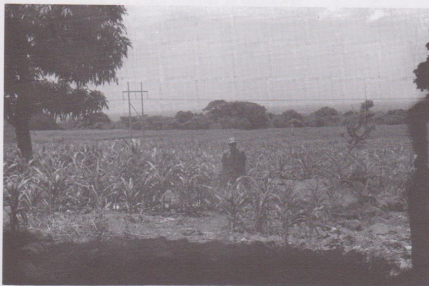
Plantación de maíz cercana a una hacienda del área urbana del pueblo de Taxisco. Una herencia agrícola del siglo XVI.

el uniforme y comprar sus útiles escolares, por lo que desistió de continuar.