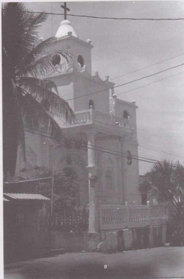
Iglesia parroquial del Cristo Negro en Taxisco, Santa Rosa, camino a la Avellana.