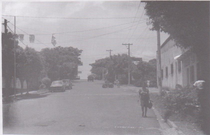
Calle del Mercado Municipal del pueblo de Taxisco, Santa Rosa.

En el caso de la tradición oral del oriente de Guatemala, por su propia impronta histórica, los elementos de transformación se han vuelto mucho más acelerados a finales del siglo XX por las migraciones a los Estados Unidos, la nueva población surgida al calor de las