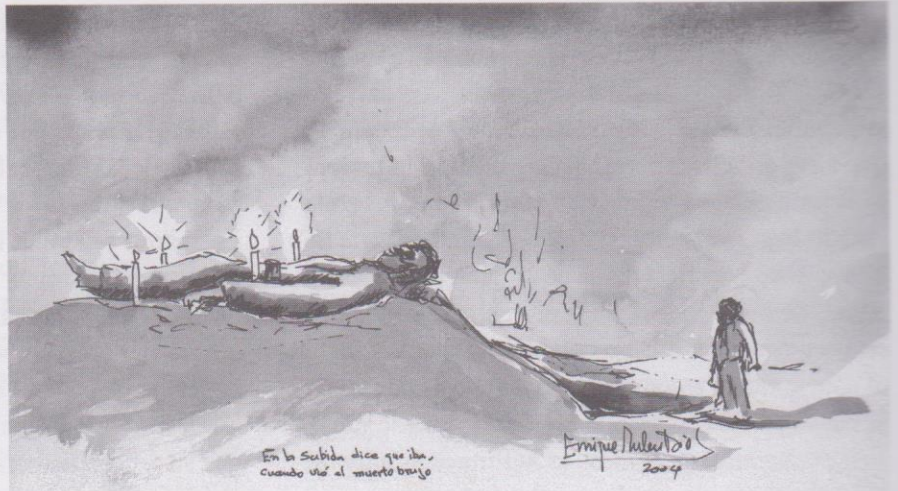
En la Subida dice que iba cuando vio al muerto brujo