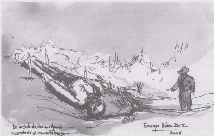
En la subida de que... cuando vió el muertobrujo -

Lo que ahora es la carretera que conduce hacia La Libertad, Escuintla, otrora era un camino de