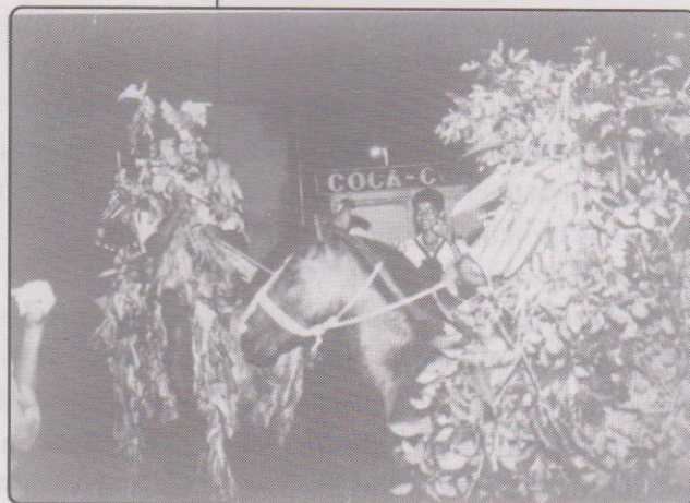
Abril inicia el desafío.

A las 5:30 de la mañana se juntaron los dos personajes montados en sus caballos frente al monumento, cada uno de ellos era seguido por sus simpatizantes, los cuales estaban preparados con sus respectivas bolsas con agua. La gente que