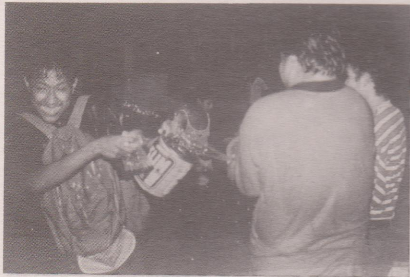
Vecinos con bolsas y botes de agua.