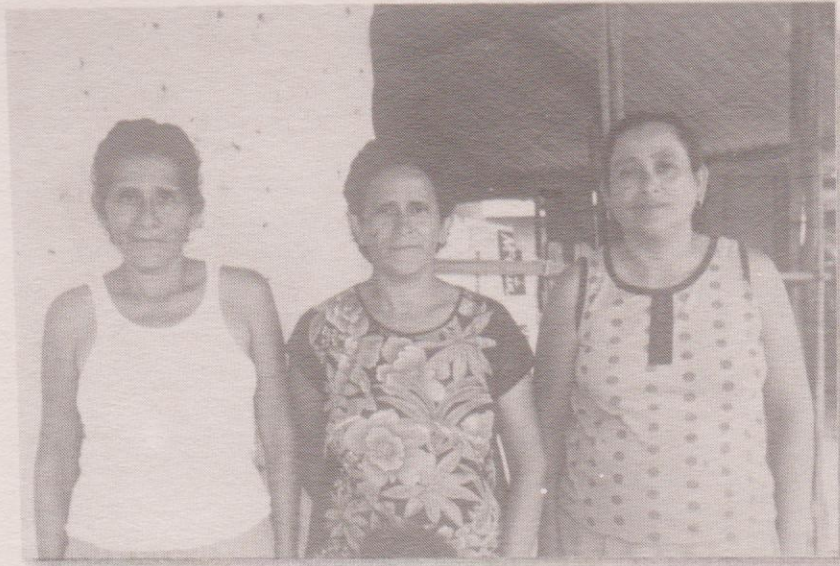
Hermanas Barahona quienes nos dieron información y hospedaje.