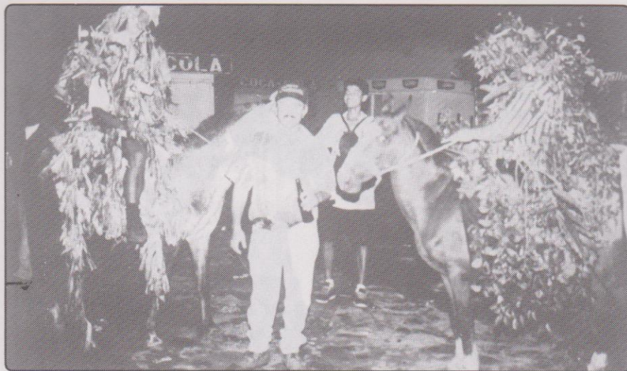
Abril y Mayo llegan frente al monumento.

los ganaderos. A las 5:00 apareció mayo pero no se dejó ver de la multitud para, evitar que le echaran agua; estaba vestido con su atuendo de hojas verdes de mamey o de mango para representar al invierno, en que todo reverdece y florece. También este personaje jalaba su caballo que era un equino retinto flaco, ensillado con aparejo de carga. Cuando la investigadora lo abordó, el personaje de mayo le hablaba a su caballo diciéndole: “oíme pues, tú eres mi mejor compañero, tú vas a engordar en este mes, ¡no! no toques lo que no tenés que tocar ¡animal!, oíme pues, aquí estamos al lado tu y yo; porque fijate la tusa como la tienen ahora vos. Aquel día que llegó Ramiro De León Carpio a los Achiotés, ¿Qué te dijo ese tipo?, y vos que te avergonzaste del justo pa’ dentro, isht, ¡quieto! a donde vas que te estoy hablando a vos, fijate en tu cara no seas tonto platiquemos”. Luego del conversatorio que tuvo con su equino, nos acercamos con los compañeros de Prensa Libre que