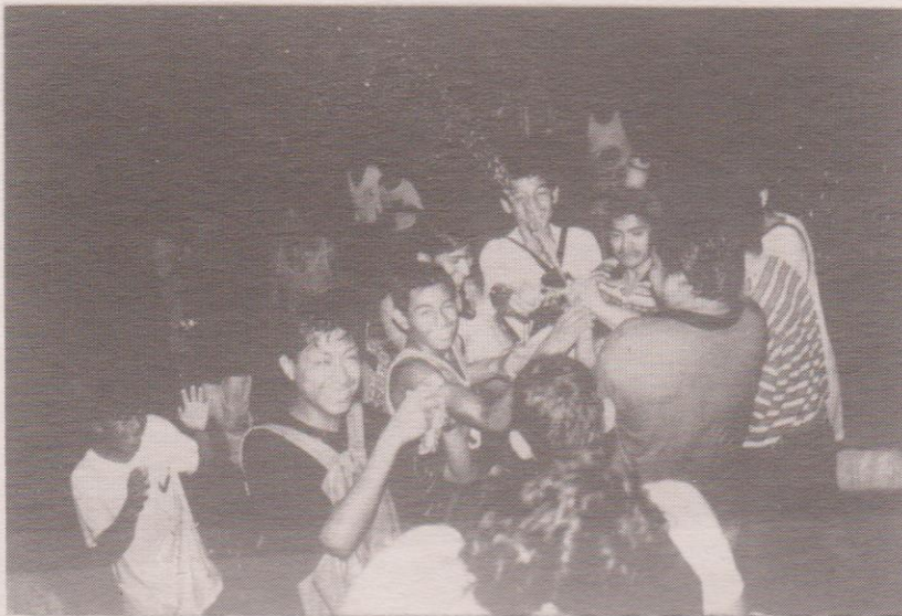
Los vecinos se tiran agua