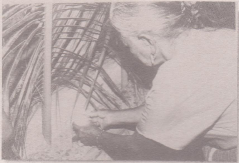
Doña Alicia enciende una veladora junto a la Cruz en el monumento Fotografía: jairo Cholutío.