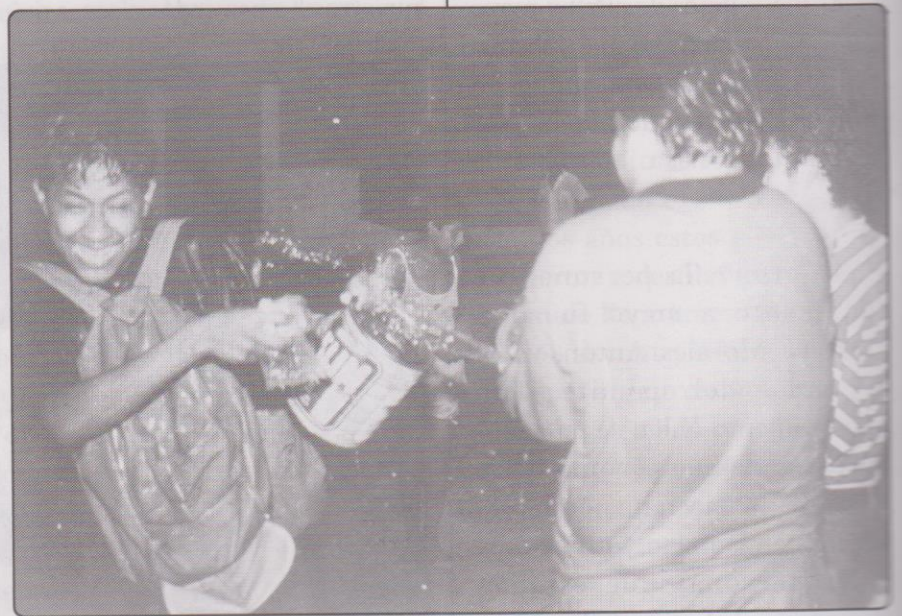
Vecinos con bolsas y botes con agua.

A las 4:30 de la mañana, aparece el primer personaje, el que representa a abril, vestido con hojas secas de guineo o plátano, jalando su caballo tordillo con una montura de aparejo de carga, en lugar de silla de montar porque, según indican los personajes "no usan monturas para evitar que puedan ser dañadas por tanta agua". Los personajes aparecieron por la calle lateral a la de la calzada de