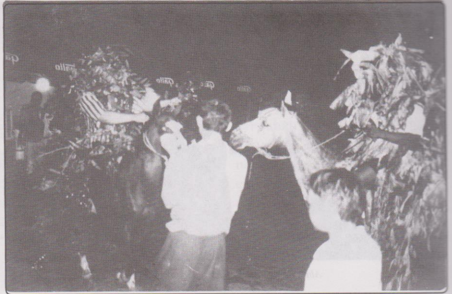
Mayo le responde.

Al terminar los versos anteriores ambos grupos se tiraban bolsas con agua y otras personas mojaban a abril y mayo con guacaladas de agua y con manguera. Luego se separaron y abril tomó por un callejón mientras que mayo se fue por la calle principal o calzada de los ganaderos. Atrás de mayo iba una gran multitud y de las casas salía