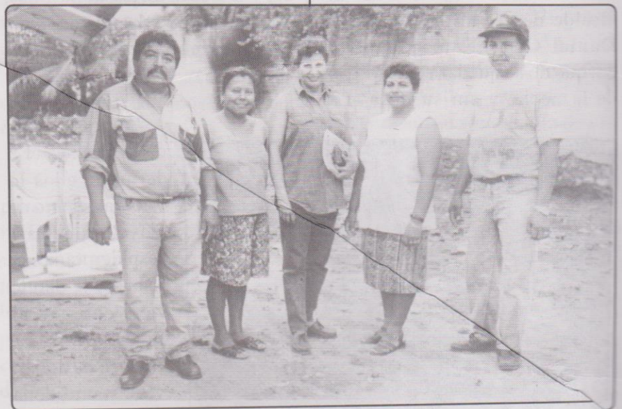
La investigadora con Miembros del Comité Pro-mejoramiento del Barrio de la Cruz