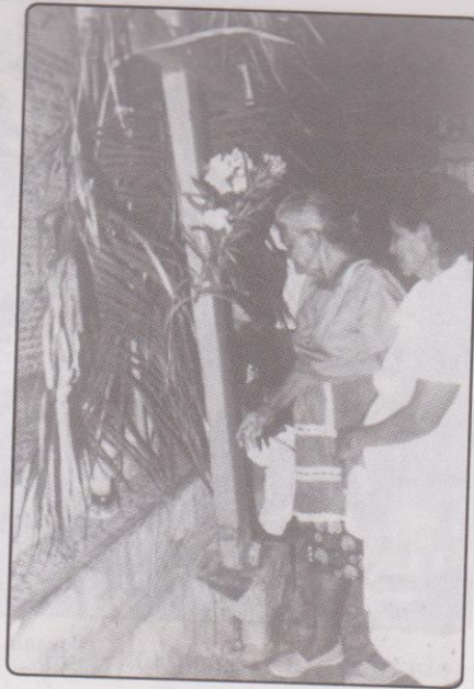
Colocación de la Cruz de Mayo al pie del monumento.