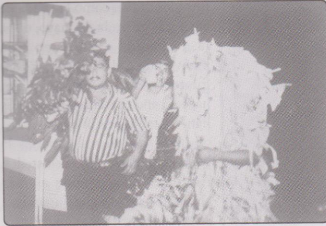
Abril y Mayo visten sus respectivos atuendos

Según Lemus y Castro (Prensa libre 11 de mayo 97), estos personajes, a pesar de su estilo chistoso de expresarse, a la hora de disfrazarse para representar sus papeles de abril y mayo, son totalmente distintos, llevan, entonces la solemnidad de la tradición y los versos bien memorizados. Abril va disfrazado con hojas secas y mayo con hojas verdes. Uno frente al otro y montados sobre sus caballos inician su desafío en un diálogo versificado.