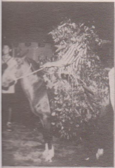
ate al monumento. Cholutío.