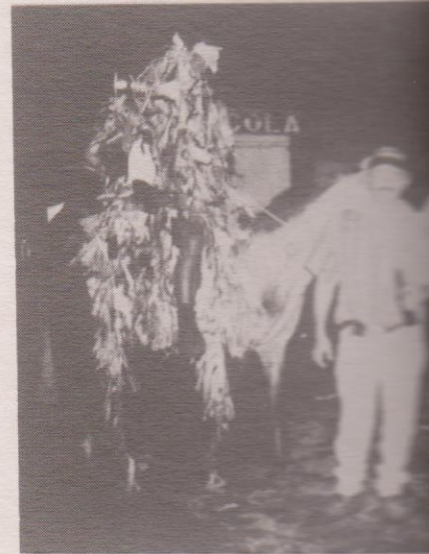
Abril y mayo llegan