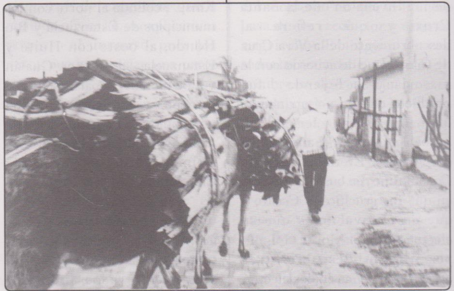
Barrio de la Cruz de Mayo

popular cobrando fama en la región. Aquí acudían con mucho fervor personas de las aldeas cercanas y otros municipios. Posteriormente dicho Oratorio fue construido formalmente por los hermanos Salguero Solano convirtiéndolo en una caseta de paredes de bajareque con techo de tejas, de unos dos metros de ancho por cinco de fondo; el frente donde se encontraba la entrada estaba situado al oeste