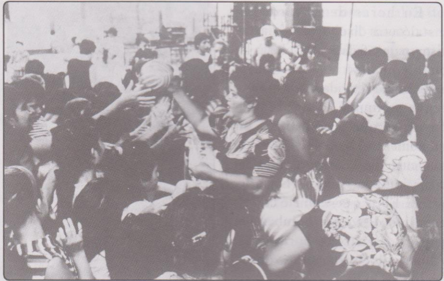
Obsequio a los Niños.